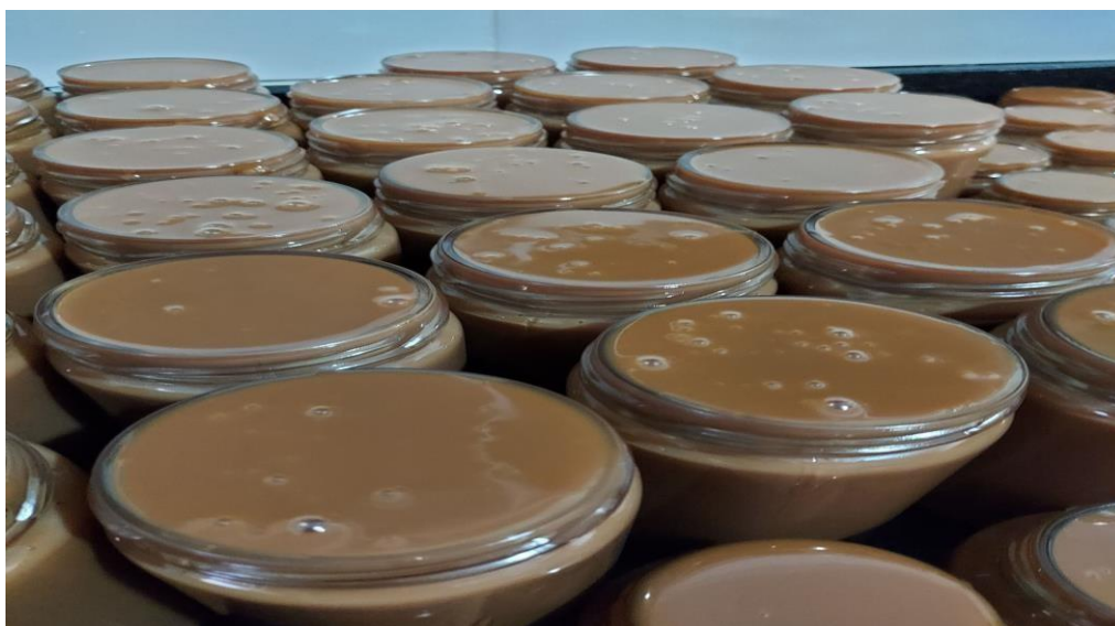
Imagem 6: Processo de envasar e embalar.

Etapa 6: O processo de envasar e embalar é feito quando o processo de fabricação do produto foi finalizado e é necessária esta etapa para prepará-lo para a distribuição. Cada produto tem uma forma correta e um tempo certo de envasar e de embalar e isso faz toda a diferença para manter a qualidade e durabilidade do produto.