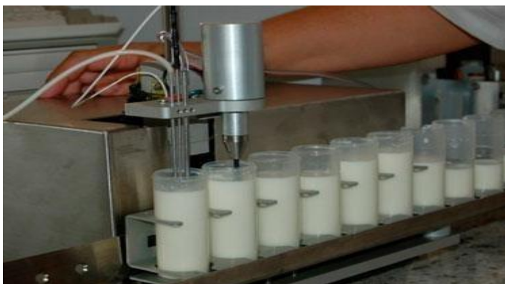
Imagem 3: Análise do leite

Etapa 3: A fazenda diariamente faz um teste do teto do animal, chamado teste da caneca de fundo preto. Este teste serve para identificar se a vaca está livre de qualquer inflamação no teto que possa contaminar o leite, como a mastite, por exemplo. E dentro do laticínio faz-se teste de acidez para a produção de cada produto, para identificar se o leite está com a acidez adequada para a produção.