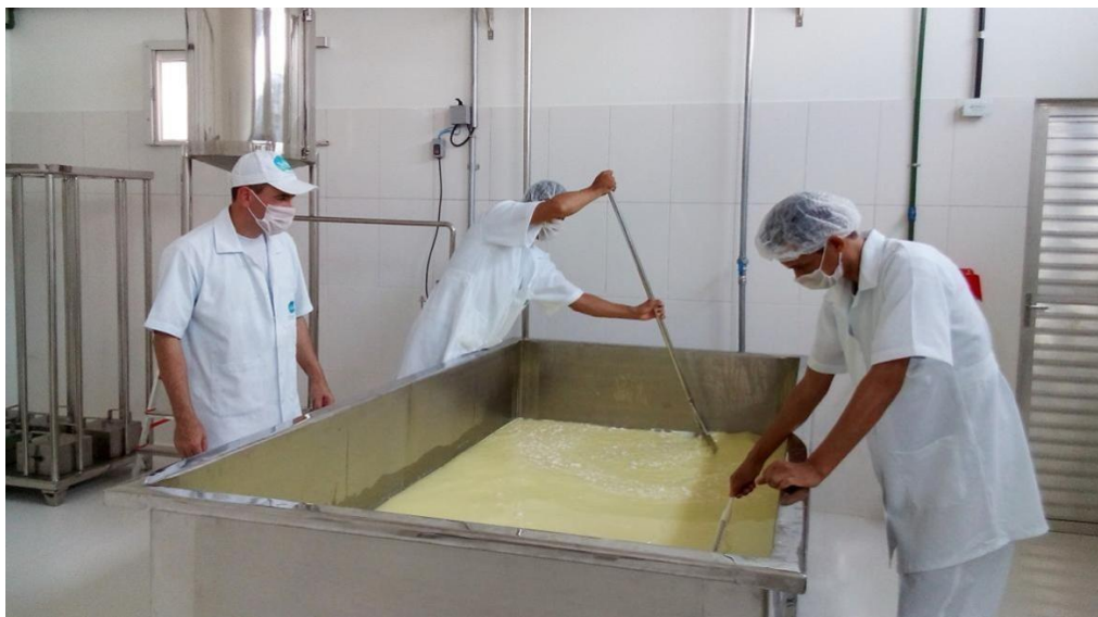
Imagem 5: Transformação da matéria prima em produto.

Etapa 6: O processo de envasar e embalar é feito quando o processo de fabricação do produto foi finalizado e é necessária esta etapa para prepará-lo para a distribuição. Cada produto tem uma forma correta e um tempo certo de envasar e de embalar e isso faz toda a diferença para manter a qualidade e durabilidade do produto.