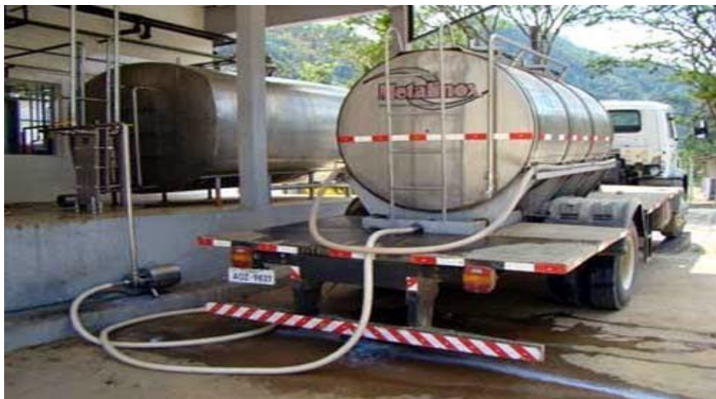
Imagem 2: Transporte do leite

Etapa 2: Como o leite é proveniente da própria fazenda do laticínio e fica a uma distância aproximada de 50 metros, o leite é transportado em latas de alumínio de 50 litros de forma manual com o auxílio de um carrinho-de-mão.