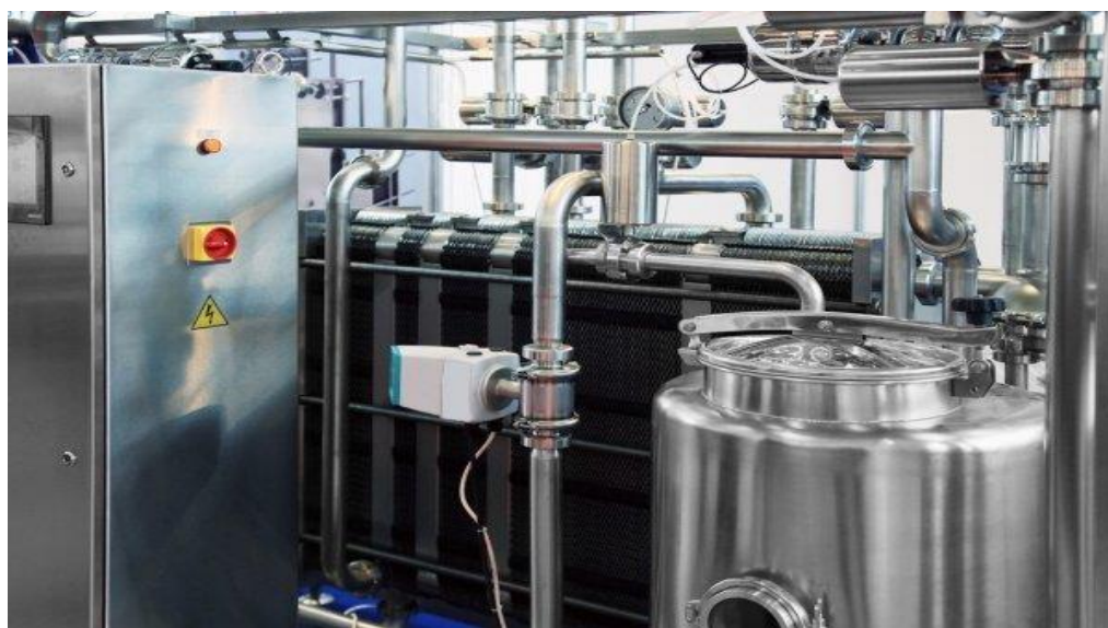
Imagem 4: Pasteurização seguida do resfriamento do leite.

Etapa 4: O leite é despejado dentro de um pasteurizador onde será aquecido até uma temperatura média de 72° a 75°C e mantido por menos de um minuto e após o aquecimento, é necessário resfriar para chegar à temperatura adequada para o tipo de produto que será produzido ou tipo de fermento no caso dos queijos.