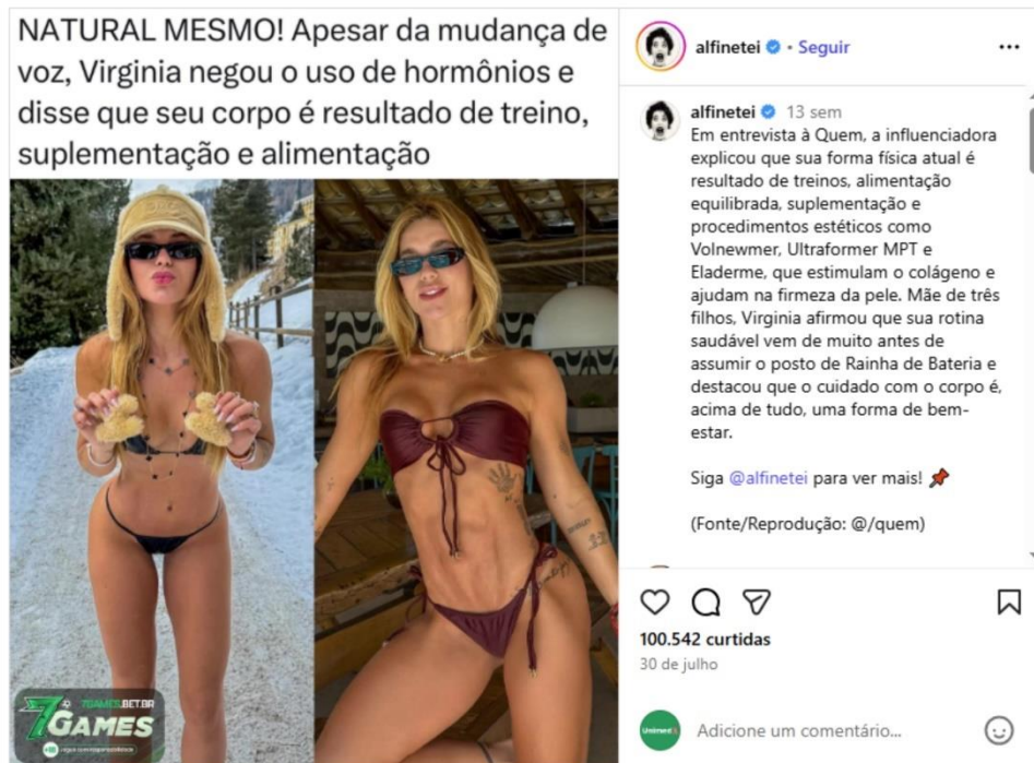
Figura 16 - Foto destacando o corpo da influenciadora