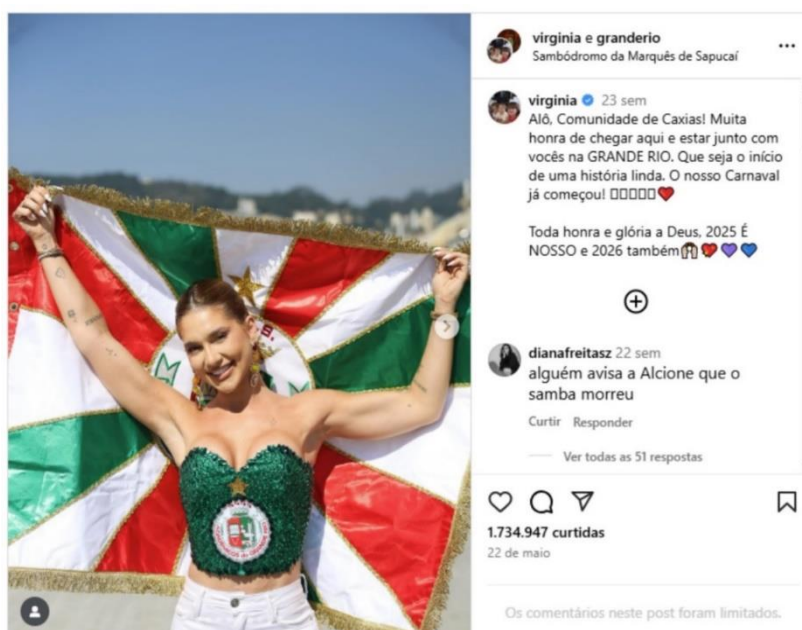
Figura 2 – Anúncio ao cargo de Rainha de Bateria (Página Virgínia Fonseca)

Dessa forma, a postagem não apenas comunica um fato, mas consolida Virgínia Fonseca como uma celebridade empreendedora (Marwick, 2015), capaz de articular sua imagem entre o entretenimento popular e a cultura digital.