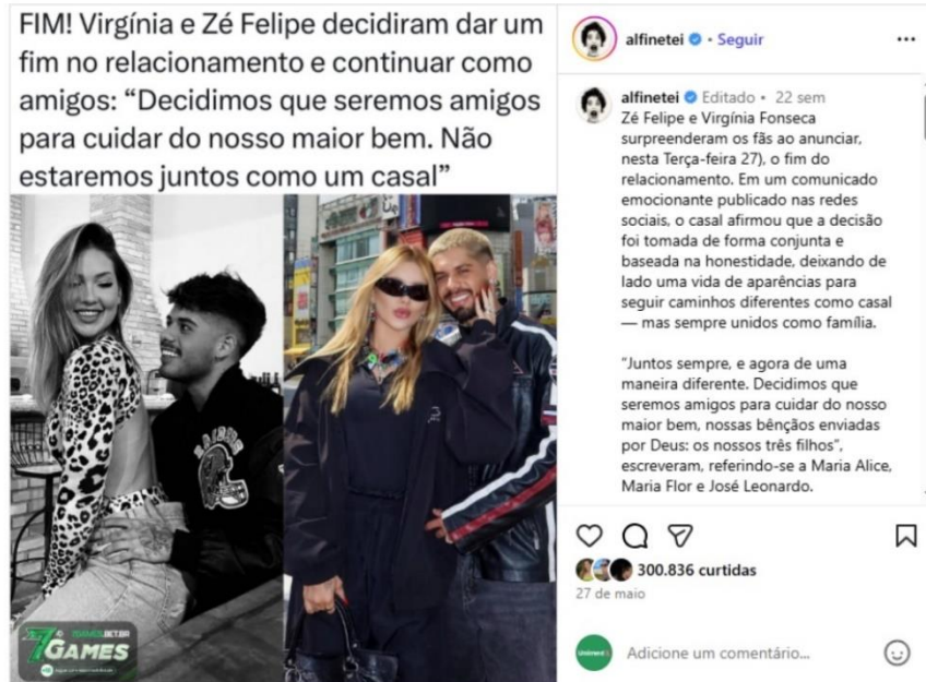
Figura 10 – Anúncio do término do casamento com Zé Felipe (Página Alfinetei)