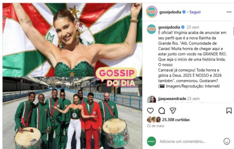
Figura 3 – Anúncio ao cargo de Rainha de Bateria (Página Gossip do Dia )