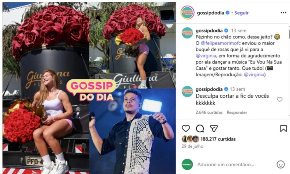
Figura 18 – Buquê de flores recebido (Página Gossip do Dia)