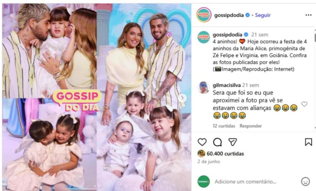
Figura 12 – Celebração da filha mais velha (Página Gossip do Dia)