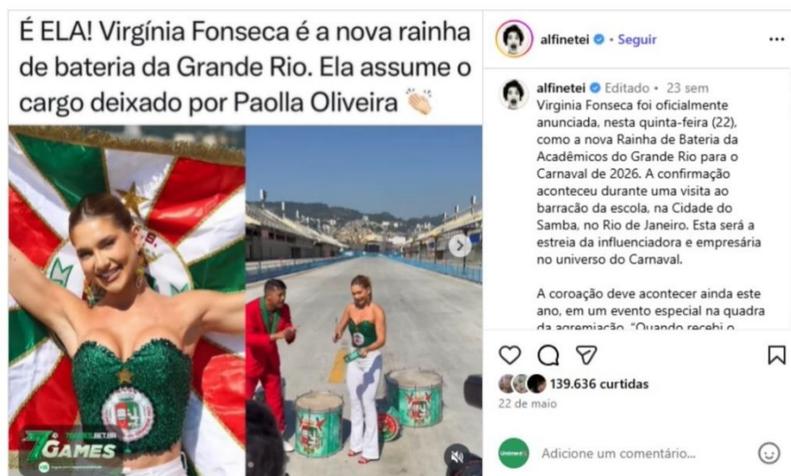
Figura 4 – Anúncio ao cargo de Rainha de Bateria (Página Alfinetei )