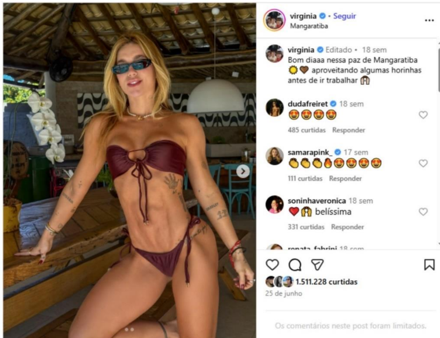
Figura 14 - Foto destacando o corpo da influenciadora (Página Virgínia)