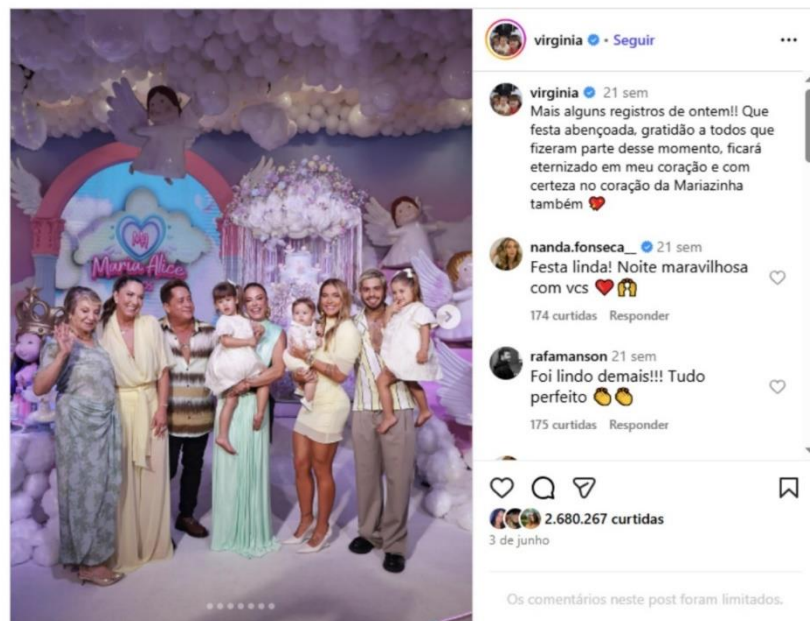
Figura 11 – Celebração da filha mais velha (Página Virgínia)