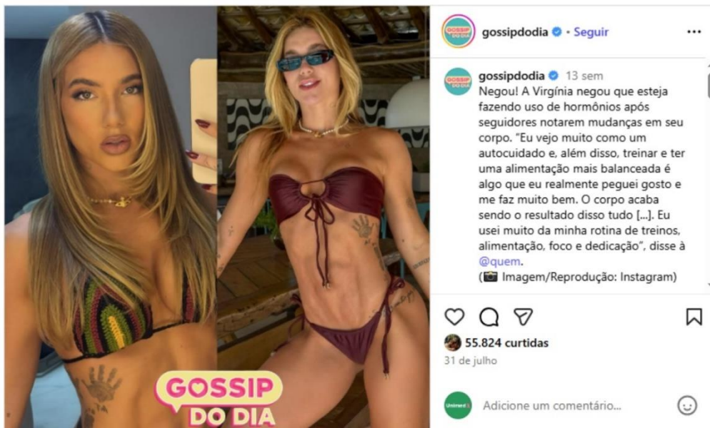
Figura 15 - Foto destacando o corpo da influenciadora (Página Gossip do Dia)

Fonte: Instagram da Gossip do Dia (2025).