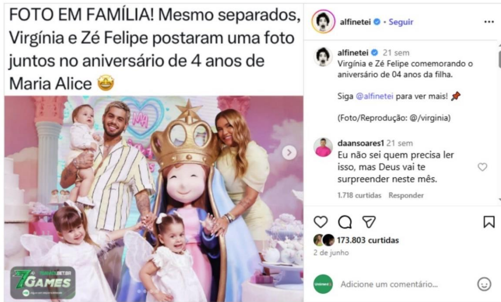
Figura 13 – Celebração da filha mais velha (Página Alfinetei )