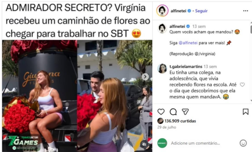
Figura 19 – Buquê de flores recebido (Página Alfinetei )