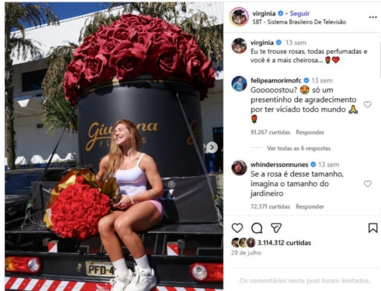
Figura 17 – Buquê de flores recebido (Página Virgínia)