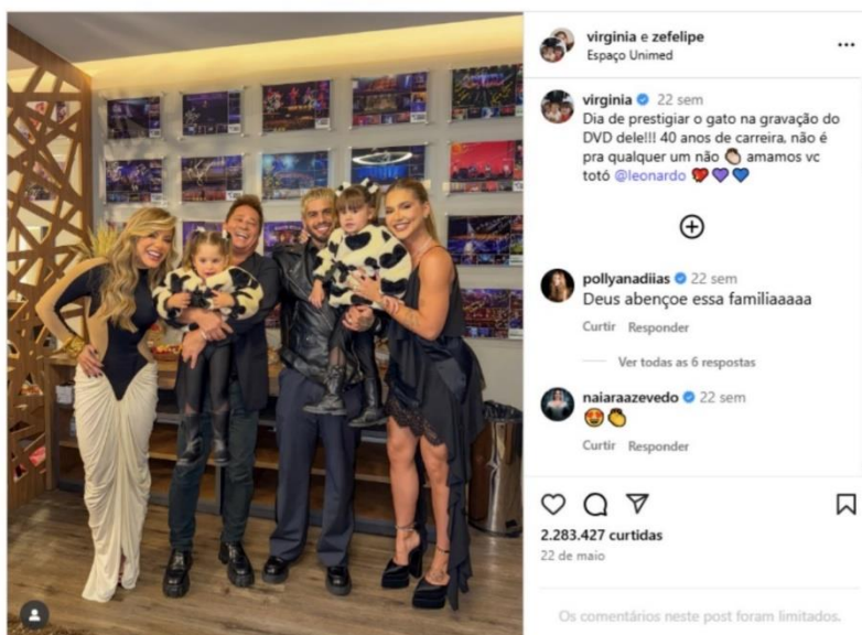
Figura 5 – Presença no show do ex-sogro Leonardo (Página Virgínia Fonseca)

Fonte: Instagram da Virgínia Fonseca (2025).