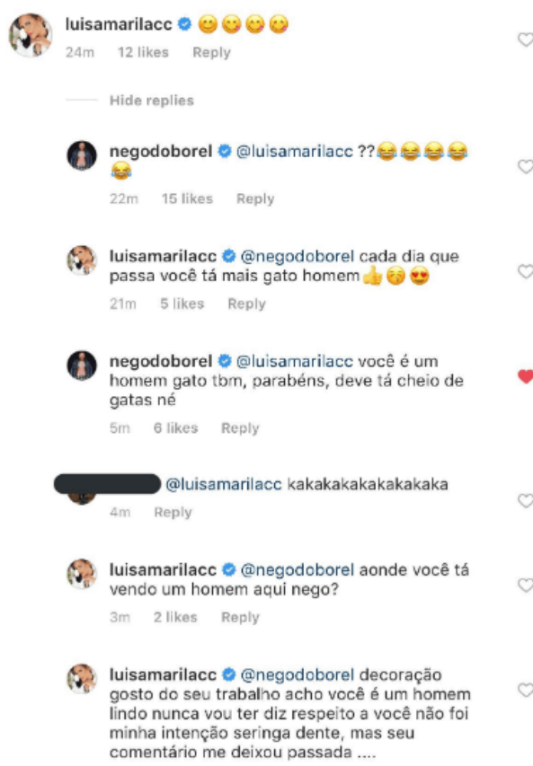
Figura 1 – Comentário Nego do Borel

De acordo com uma matéria publicada no site do Correio Braziliense, em 14 de janeiro de 2019, o fato teria acontecido após um comentário feito por Luísa Marilac, uma personalidade transexual, em que ela elogiava o cantor por ser um homem bonito. Em resposta ao seu comentário, o cantor respondeu que a artista “também era um homem bonito e que devia ter várias gatas”, conforme mostra a Figura 1.