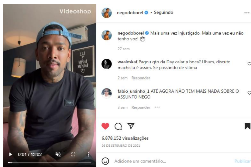
Figura 6 – Vídeo de Nego do Borel se posicionando pós A Fazenda

Após a sua saída do reality, Nego do Borel se pronuncia por meio de um vídeo de 13min e 02s, postado também no seu perfil oficial do Instagram, onde faz um esclarecimento detalhado sobre todos os casos que ele foi acusado, dizendo que havia sido injustiçado mais uma vez e que não tinha voz.