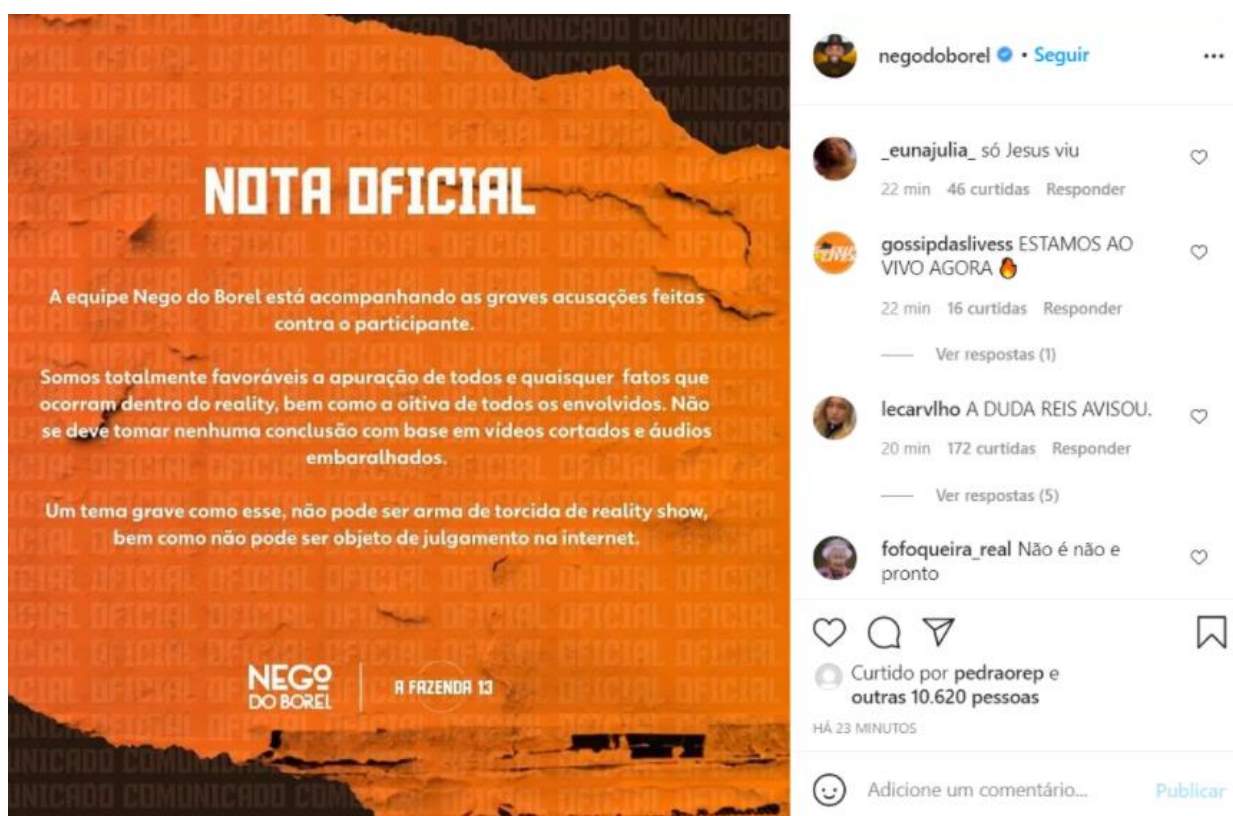
Figura 4 – Publicação oficial sobre as acusações contra Nego do Borel na A Fazenda