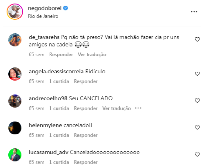
Figura 2 – Comentários na publicação de Nego do Borel

denominação de ‘cancelamento’ perante aos fatos que são considerados pelo público como inadmissíveis.