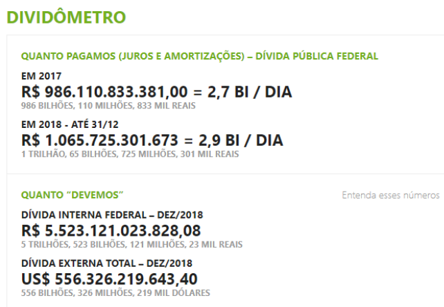
Figura 3 Dividômetro