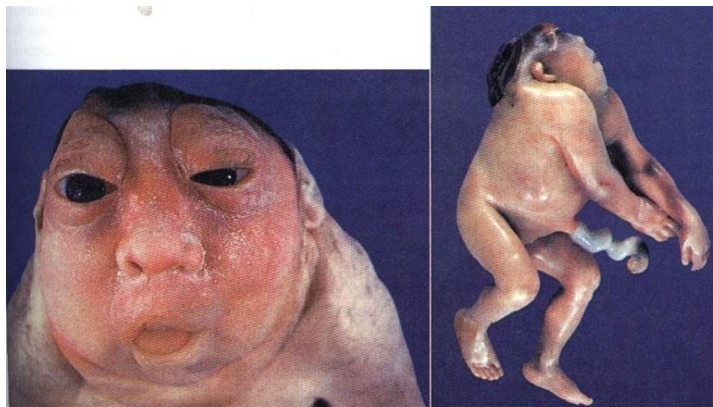
Imagem 3 – Feto anencéfalo