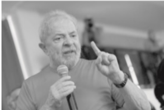
Supremo instruiu Lula para não agir e pode acabar preso quando recursos esgotarem

Sessão começou na quarta-feira e decisão só saiu na madrugada desta quinta, com voto decisivo da presidente do Supremo