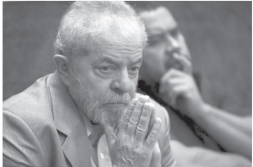
Na frente: Lula teve pedido de prisão antecipado ao que era esperado pelo mesmo jurídico

No recurso apresentado ao TRF4, a defesa alegou que a análise de Moro foi "parcial e facciosa" e "descoberta de qualquer elemento probatório idôneo". Os advogados afirmaram