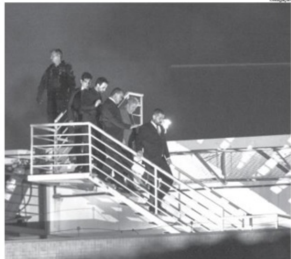
Chegou: Lula desce o helicóptero para se entregar aos policiais federais em Curitiba

O juiz federal Sérgio Moro, responsável pela Operação Lava Jato na primeira instância, condenou