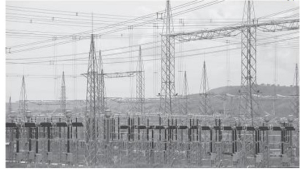
Iluminando: Problema que originou o blecaute já foi solucionado

O relatório foi encaminhado aos agentes envolvi-