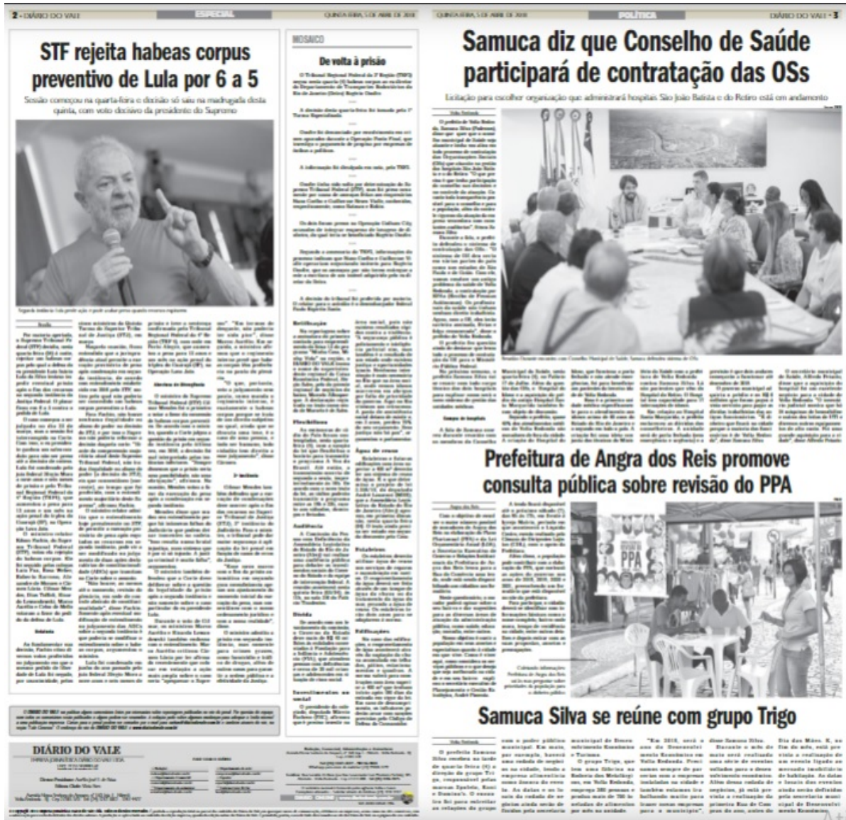
Figura 3: Editorias Especial e Política dia 05 de abril de 2018