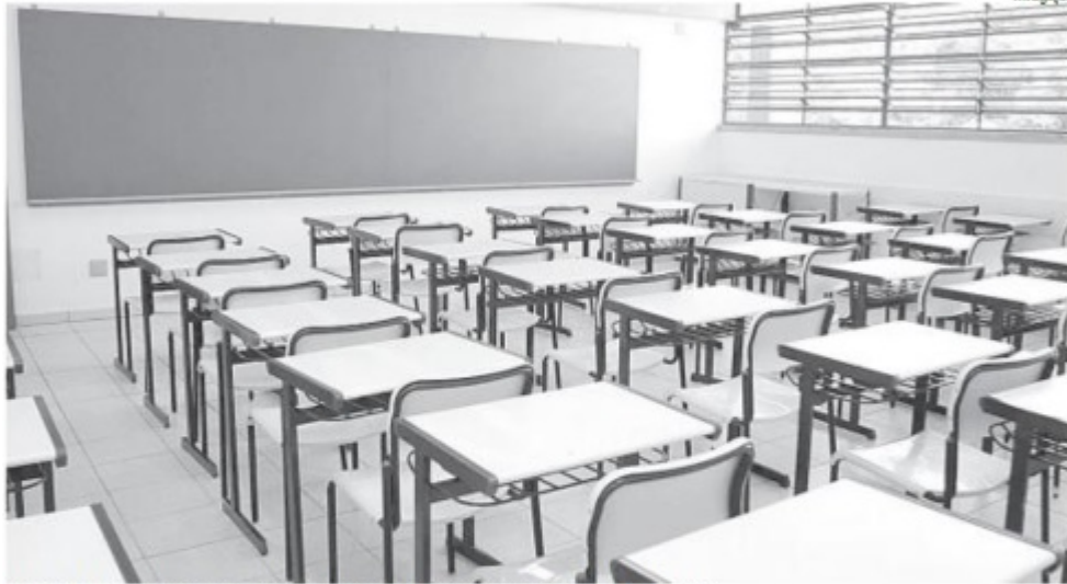
Insino: Programa vai apoiar financeiramente os estados para assegurar a qualidade técnica