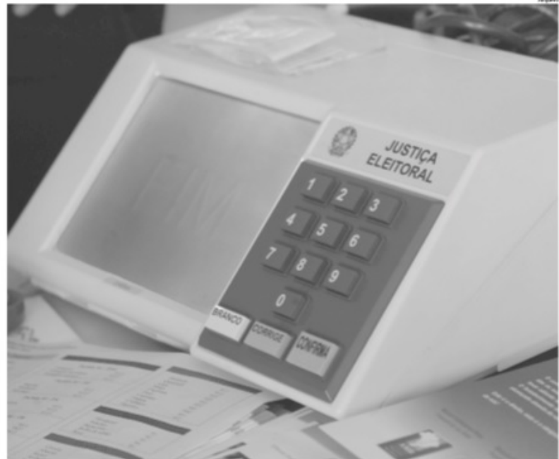
Eleição: Showmícios e eventos semelhantes continuam proibidos, mesmo que os artistas que se apresentarem o façam gratuitamente

Os showmícios e eventos semelhantes continuam proibidos, mesmo que os artistas que se apresentem o façam gratuitamente. A exceção é para candidatos que sejam profissionais da classe artística, cantores, atores e apresentadores, que poderão exercer as atividades normais de sua profissão durante o período eleitoral, exceto em progra-