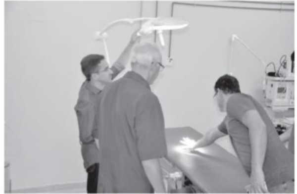
Testando: Prefeito, secretário de Saúde e diretor do hospital verificam sala de cirurgia