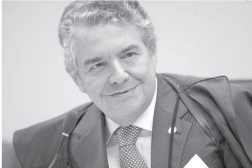
Mudanças: Marco Aurélio Mello deve levar discussão novamente ao plenário do Supremo Tribunal

Entre os argumentos, está o de que, no julgamento, iniciado na semana passada, o ministro Gilmar Mendes manifestou mudança de entendimento em relação ao que havia votado em 2016, decidindo agora que a