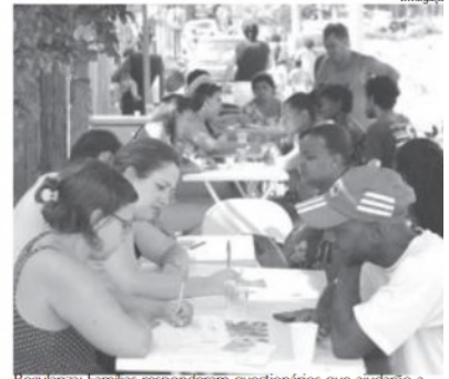
Regulariza: Famílias responderam questionários que ajudarão a elaborar projetos

"Esse levantamento está sendo realizado para que a prefeitura tenha dados mais precisos e assim, consigamos continuar com as ações a fim de se buscar as soluções para essa área. Hoje, há risco inclusive para as pessoas com a proximidade da linha férrea e o Rio Paraíba do Sul. Nós estamos estudando várias possibilidades para resolver a situação desses moradores. O importante é encontrarmos essas respostas e soluções o mais rápido possível para que essas famílias possam ter mais tranquilidade", enfatizou o prefeito.