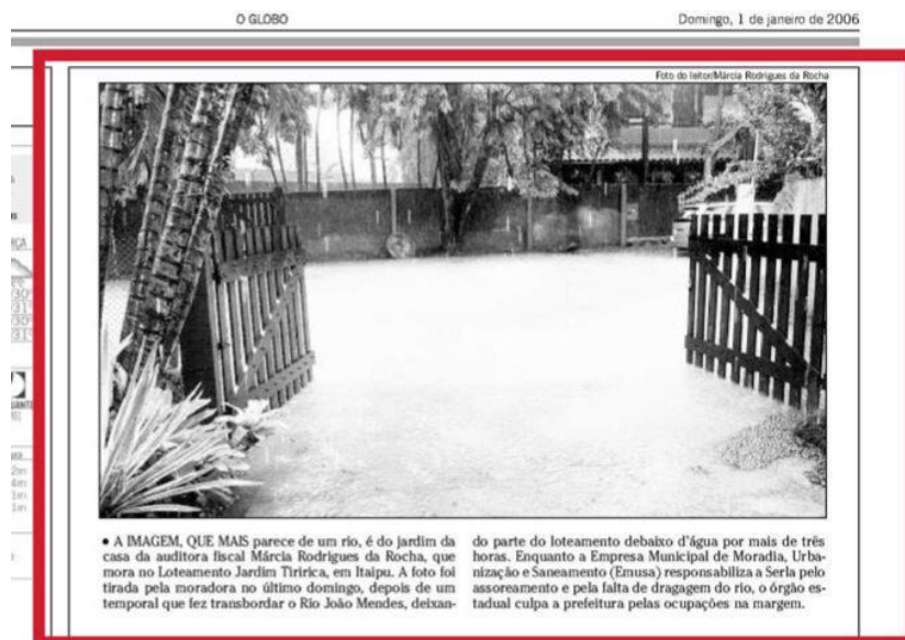
Figura 21: caderno do “Fala, Niterói” com participação de leitor.