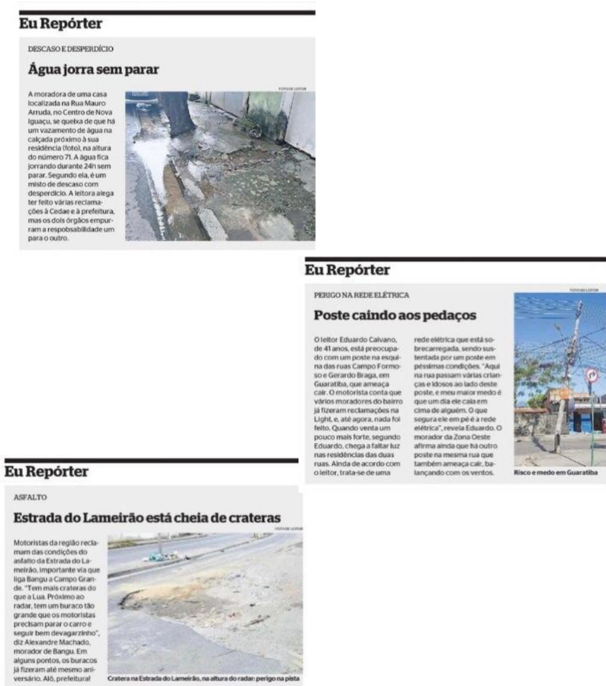
Figura 17: Fotos dos leitores no “Eu Repórter” em 2019