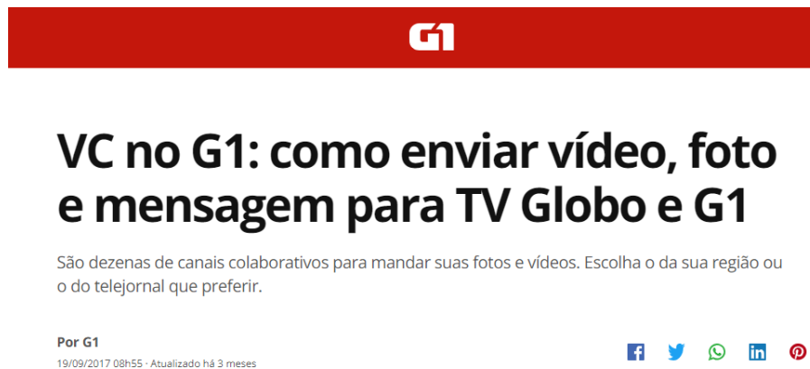
Figura 10: Página para selecionar os canais colaborativos do G1