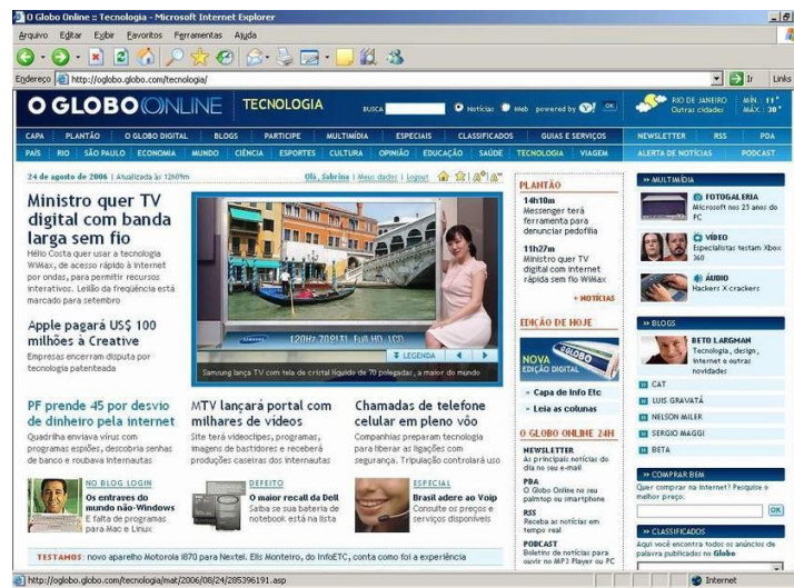
Figura 12: Página do O Globo Online