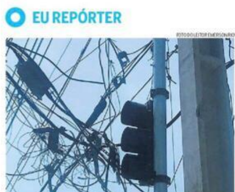
Figura 16: formas de encontrar o “Eu Repórter” no Jornal de Bairro