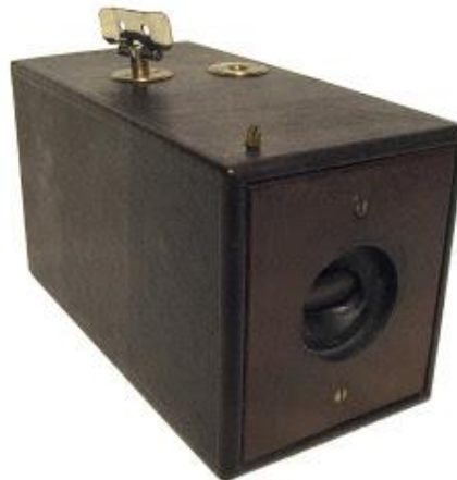
Figura 5: a Kodak nº1 de Eastman