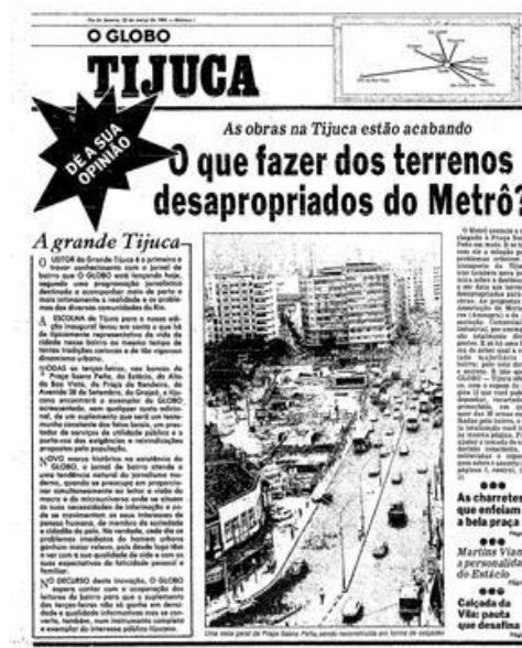
Figura 15: Primeiro jornal de bairro

Fonte: Disponível em: < http://memoria.oglobo.globo.com/linha-do-tempo/jornais-de-bairro-9173648 >