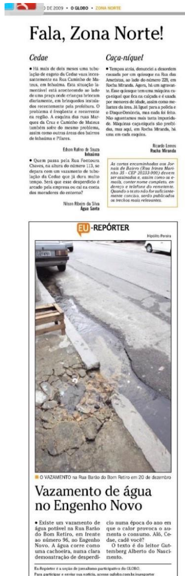
Figura 22: caderno “Fala, Zona Norte” de 2009