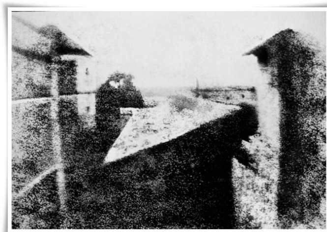
Figura 2: primeira fotografia da história