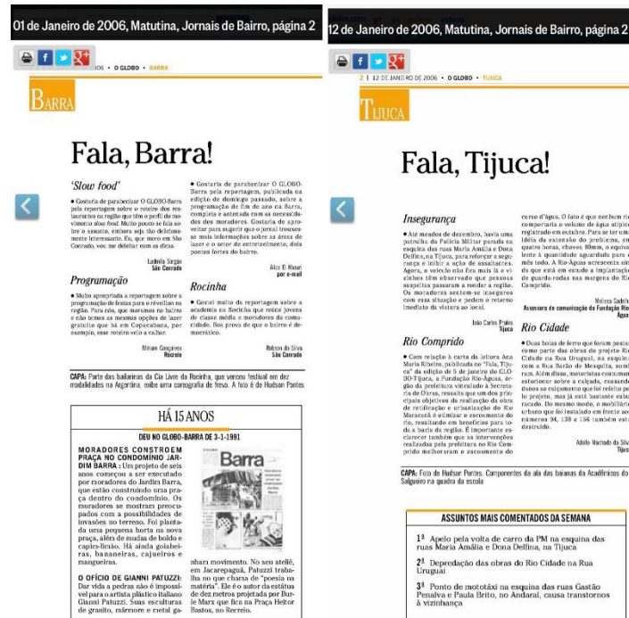
Figura 19: Cadernos Tijuca e Barra de 2006