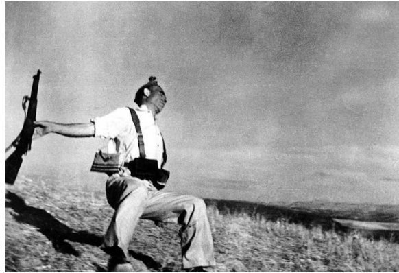
Figura 8: famosa fotografia de Robert Capa