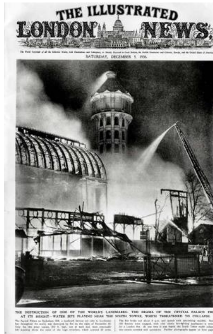
Figura 6: a reprodução da fotografia documental do incêndio