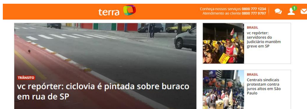
Figura 11: Notícias publicadas no “VC no G1” do portal Terra