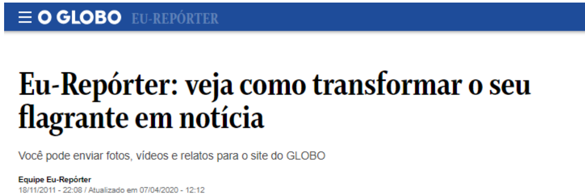
Figura 13: Página do “Eu Repórter” do O Globo