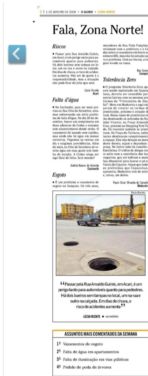
Figura 20: suplemento “Fala, Zona Norte” de 01/01/2006