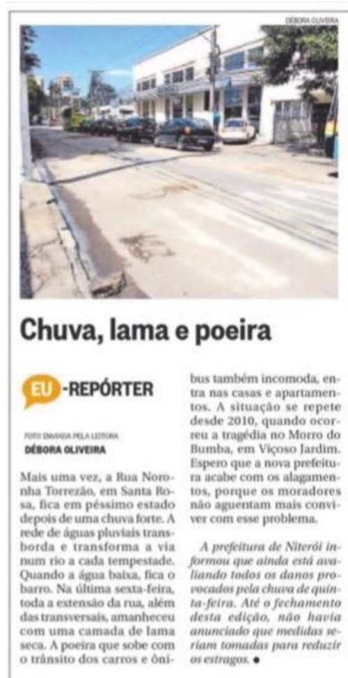
Figura 25: perfil do “Eu Repórter” em 2013