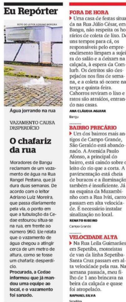
Figura 24: Relato de leitor na seção do “Eu Repórter”