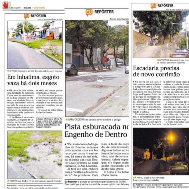
Figura 23: caderno “Fala, Zona Norte” com participação de leitores.

textos são feitos por um leitor e todos com o mesmo objetivo de mostrar a insatisfação sobre o problema relatado. O nome do leitor aparece, na maioria das vezes, em cima da foto publicada e assim, há sempre a citação da fonte daquela foto ou texto.