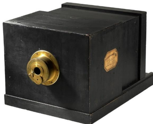
Figura 3: a invenção de Daguerre