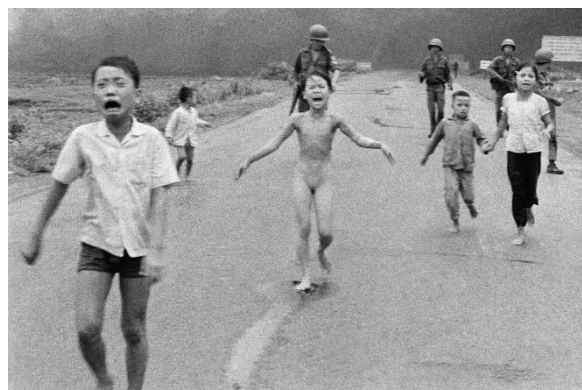
Figura 9: imagem de Nick Ut da Guerra do Vietnã

Fonte: Disponível em: < https://veja.abril.com.br/mundo/a-menina-da-foto-a-historia-por-tras-de-um-simbolo-da-guerra-do-vietna/ > Acesso em 28 mai. 2020