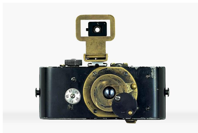
Figura 7: primeira Leica

Os avanços tecnológicos passaram a ser cada vez mais frequentes e em 1914 o alemão Oskar Barnak inventou a primeira câmera portátil de precisão (Figura 7). Este equipamento era útil para fotografias artísticas e de registros cotidianos. Era fácil de usar e tinha uma lente 35 mm. Na época, a eclosão da Primeira Guerra Mundial atrasou sua comercialização, e a Leica só chegou ao mercado em 1925 (BLAIR, 2011).