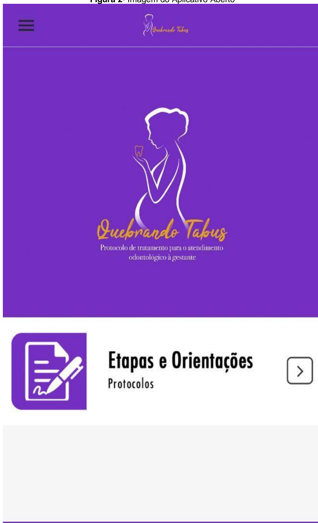
Figura 2- Imagem do Aplicativo Aberto