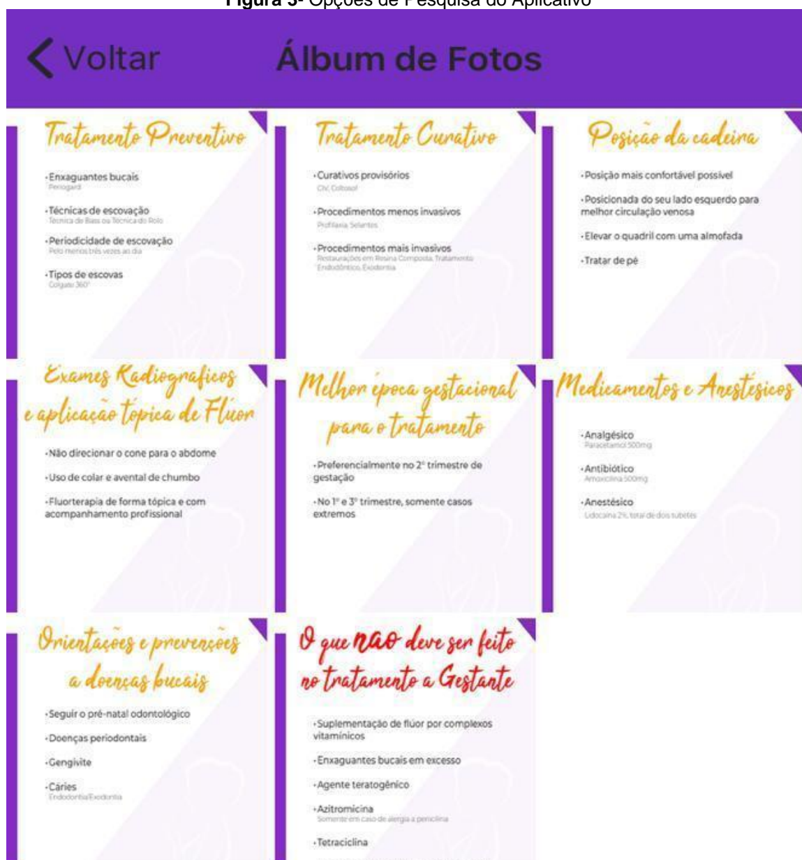
Figura 3- Opções de Pesquisa do Aplicativo