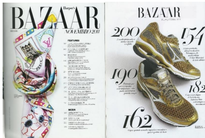
Figura 27: Sumário Bazaar 2011 e 2016

Nos sumários (Figura 27), por sua vez, percebe-se a aplicação de estratégias editoriais e de elementos similares. Observa-se também o uso reiterado de imagens fotográficas; a distribuição dos conteúdos/artigos exprime o que a revista deseja ressaltar e julga importante para a leitora.