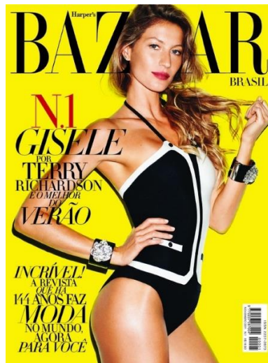
Figura 2: Capa Harper's Bazaar Brasil n°1

estampada pela supermodelo brasileira Gisele Bündchen, que posteriormente aparece em um dos editoriais fotográficos publicados. São apresentadas apenas duas chamadas com variações de tamanhos e estilo da mesma fonte – entre regular e itálico – conforme mostrado na Figura 2 a seguir: