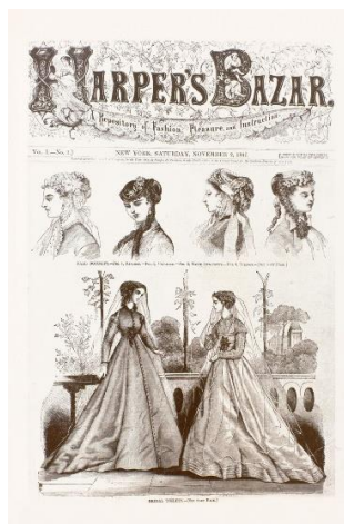
Figura 1: Capa da primeira edição da Harper's Bazaar