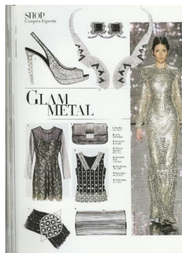
Figura 6: Shop Harper’s Bazaar Brasil nº 13

O número de colunas varia entre uma ou três, de acordo com as necessidades de cada página. Nos momentos em que os textos são mais extensos, estes são fragmentados em mais colunas, pois as linhas mais curtas os tornam mais agradáveis e fáceis de serem lidos (WHITE, 2012). A assimetria das páginas é mantida, porém é possível identificar a disposição dos elementos em grades e uso de ângulos e linhas retas bem demarcadas, bem como a adoção de um visual mais minimalista (Figura 6).