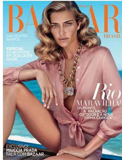
Figura 8: Capa Harper's Bazaar Brasil nº 36