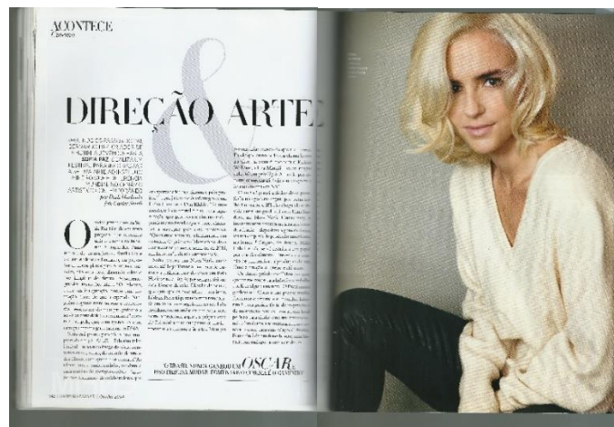
Figura 9: Acontece Cinema Harper's Bazaar Brasil nº 36

Em determinados momentos as margens são irregulares ou as fotografias rompem os limites estabelecidos, características que variam de acordo com a necessidade e natureza da página em questão, mas ainda assim atuam na construção da identidade da publicação, como mostra a Figura 9.