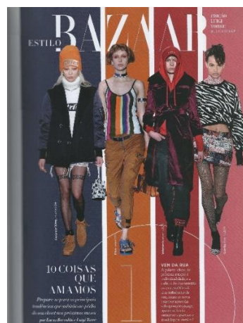
Figura 13: Capa interna Harper's Bazaar Brasil nº54

A capa interna da editoria Estilo e as páginas destinadas ao artigo '10 coisas que amamos', também contam com elementos gráficos para a construção da referência ao esporte. Novamente são criadas raias de corrida como fundo utilizando faixas verticais coloridas (Figura 13). Tais mudanças caracterizam adequações da diagramação à temática proposta.