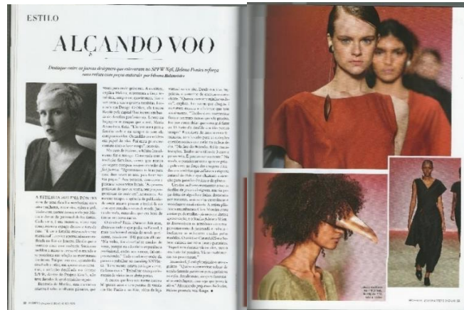
Figura 19: Harper's Bazaar Brasil n°82