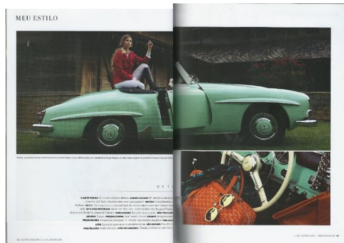
Figura 14: Meu Estilo Harper's Bazaar Brasil n° 54

A disposição dos elementos é feita buscando tornar clara a identificação das páginas como conjuntos (Figura 14). O uso dos panoramas maiores amplifica o impacto das páginas e fotografias, afinal o alinhamento horizontal cria sensação de largura (WHITE, 2012).