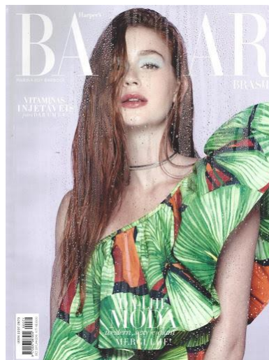
Figura 15: Capa Harper's Bazaar Brasil n° 71

A edição bimestral corresponde à última de 2017 e a primeira de 2018, tem a capa estampada pela atriz Marina Ruy Barbosa, que posteriormente aparece em dois dos editoriais fotográficos publicados. São apresentadas apenas duas chamadas com a tipografia padrão da Bazaar, porém em escala reduzida e em cores que contrastam pouco com o fundo da fotografia, mantendo o foco na imagem da atriz, conforme mostrado na Figura 15 a seguir.