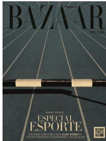
Figura 11: Capa Harper's Bazaar Brasil nº 54