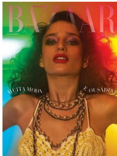
Figura 18: Capa Harper's Bazaar Brasil nº82

A publicação de fevereiro de 2019 celebra o Carnaval. A capa conta com cores fortes que variam entre tons de verde, azul, amarelo e vermelho. Observa-se que a única chamada presente é fragmentada e disposta rente aos ombros da modelo. Mesmo que a tipografia permaneça a mesma, a forma que o texto é utilizado passou por mudanças (Figura 18). Percebe-se que a técnica aplicada dialoga com a chamada e com a temática da edição: “Muita moda e ousadia”.