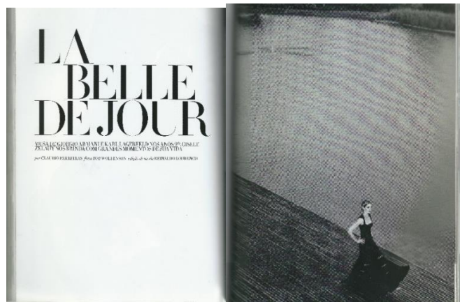
Figura 28: Editorial La belle de jour

e o comercial, seja em função das modelos escolhidas ou do styling – produção de moda. Referente à produção de fotografias, observa-se, de modo geral, que as matérias são compostas por fotografias de caráter documental, stills de moda, e das fotografia de moda para editoriais, previamente mencionadas (CALZA, 2015), privilegiando e fazendo uso dos três tipos de imagens conforme a abordagem do conteúdo – variando entre tendência, serviço ou comportamento (Figuras 28).