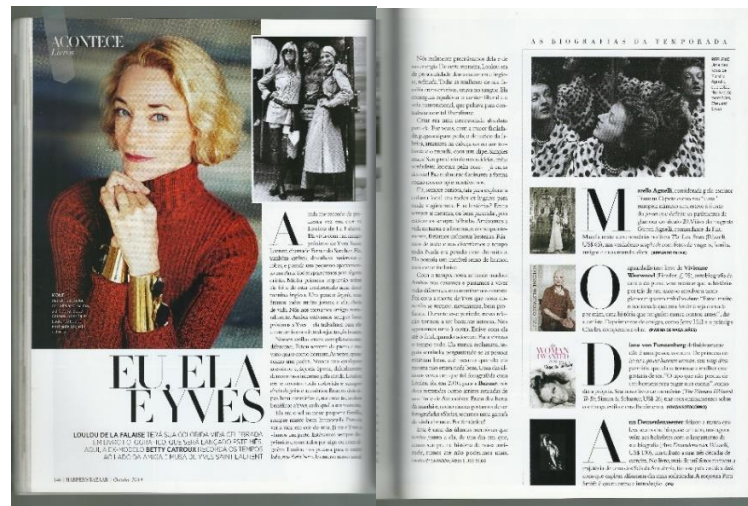
Figura 10: Acontece Livros Harper's Bazaar Brasil nº 36

define como parte da identidade editorial e cria um efeito de moldura, conferindo aspecto luxoso (WHITE, 2012).