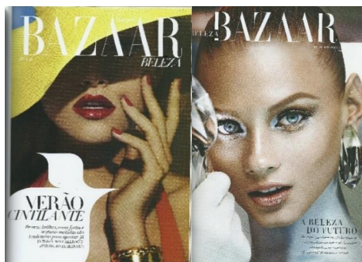
Figura 26: Capas internas Bazaar Beleza 2011 e 2020

As alterações visuais identificadas visam a adequação do título àquilo que o torna singular e o conecta ao seu leitor; transformações que sugerem ainda a busca da revista em tornar o momento da leitura mais agradável considerando critérios de legibilidade e fruição estética (Figura 26).