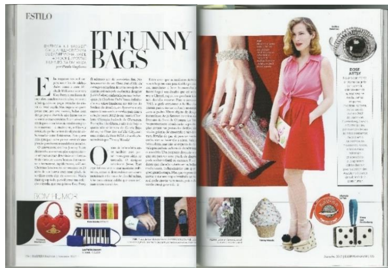
Figura 7: Estilo Harper's Bazaar Brasil nº 13

vinhetas deixaram de ser apresentadas em itálico e os subtítulos deixaram de ser serifados (Figura 7).