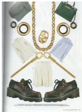
Figura 29: Shop Bazaar n° 99

Os stills são incluídos com frequência e estampam as matérias de serviço da publicação, que apresentam sugestões de roupas, acessórios e produtos de beleza. Além de serem apresentadas possíveis combinações através das colagens e fotomontagens (Figura 29).