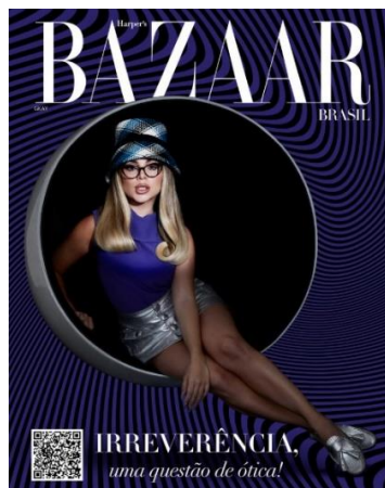
Figura 23: Capa Harper's Bazaar Brasil n° 99

No momento da pandemia de Covid-19 a revista aposta em conferir leveza a temas sérios como saúde mental e machismo. A capa da edição é estampada pela humorista, youtuber e atriz Gessica Kayane, mais conhecida como Gkay na internet (Figura 23). O editorial publicado com a humorista, assim como a capa, é tomado por elementos que remetam às ilusões de ótica e um QR code incluído no canto inferior esquerdo, o qual direciona a leitora ao site para compra dos óculos usados por GKay no editorial.