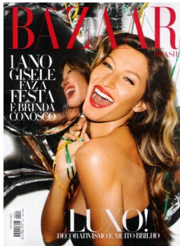
Figura 5: Capa Harper's Bazaar Brasil nº 13

Em novembro de 2012 a Harper's completou 1 ano desde o seu lançamento no Brasil. A capa da edição comemorativa é novamente estampada pela supermodelo Gisele Bündchen, que celebra junto à revista o primeiro ano de publicações no Brasil. Além disso, a 13ª edição marca o período em que o veículo realizou alterações em seu projeto gráfico (Figura 5).