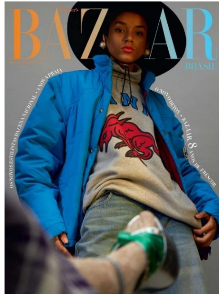
Figura 20: Capa Harper's Bazaar Brasil n° 90