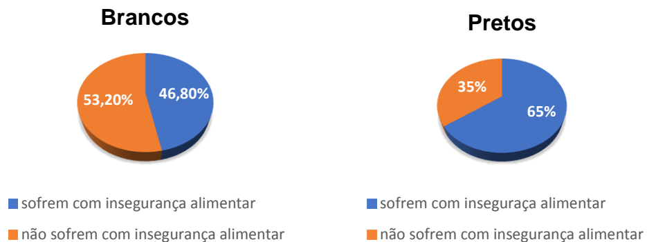
Figura 3: A distribuição da fome pela cor da pele

Outro dado importantíssimo é a questão da insegurança alimentar, com base na análise da cor dos indivíduos, sendo que os números mostram a desigualdade gritante, na qual nos domicílios que as pessoas se autodeclaram brancas são bem menores que os números apresentados por pessoas que se autodeclaram pretas ou pardas, como se segue abaixo na figura 3: