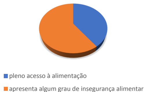
Figura 1: Acesso a alimentação a cada 10 domicílios

De acordo com os dados obtidos pela Rede Brasileira em Soberania e Segurança Alimentar e Nutricional, a situação é muito mais séria do que aparenta ser, uma vez que a cada 10 (dez) domicílios, apenas 4 (quatro) não sofrem com a insegurança alimentar, conforme observado na figura 1, ou seja, tem acesso pleno à alimentação, sendo que os 6 (seis) restantes se subdividem em uma escala das pessoas que sofrem algum grau de insegurança e até mesmo aquelas que já passam fome (REDE PENSSAN, 2022).