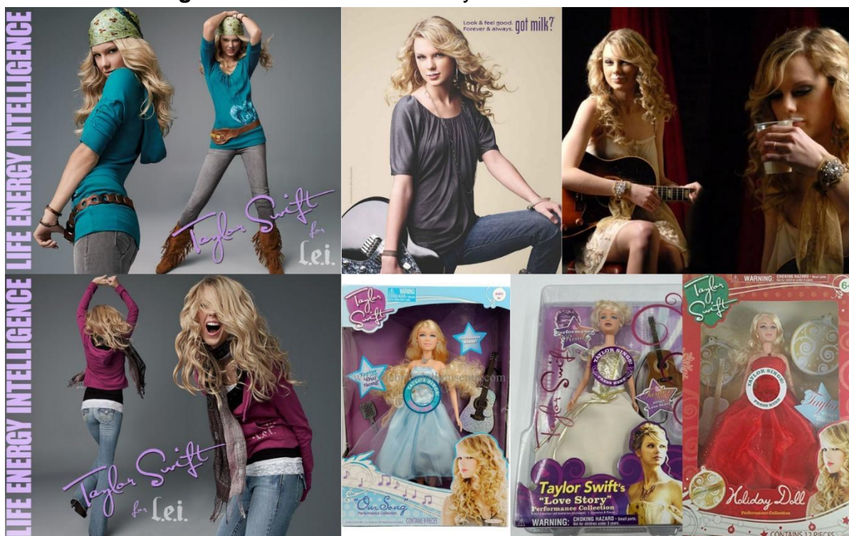
Figura 3 — A influência de Taylor Swift na Publicidade

Fonte: imagens de fontes diversas da internet 8