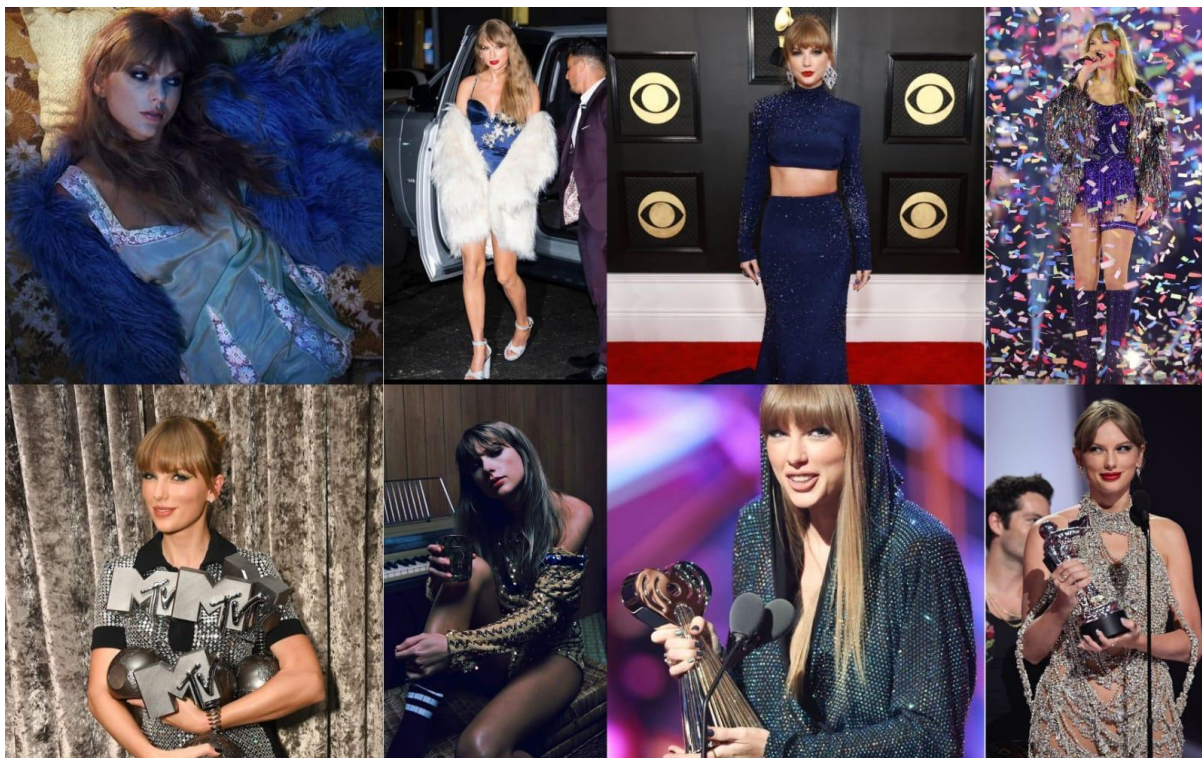
Figura 13 — A Era Midnight

22