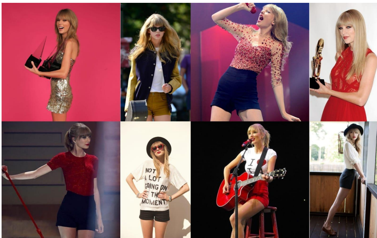
Figura 5 — A Era Red

12