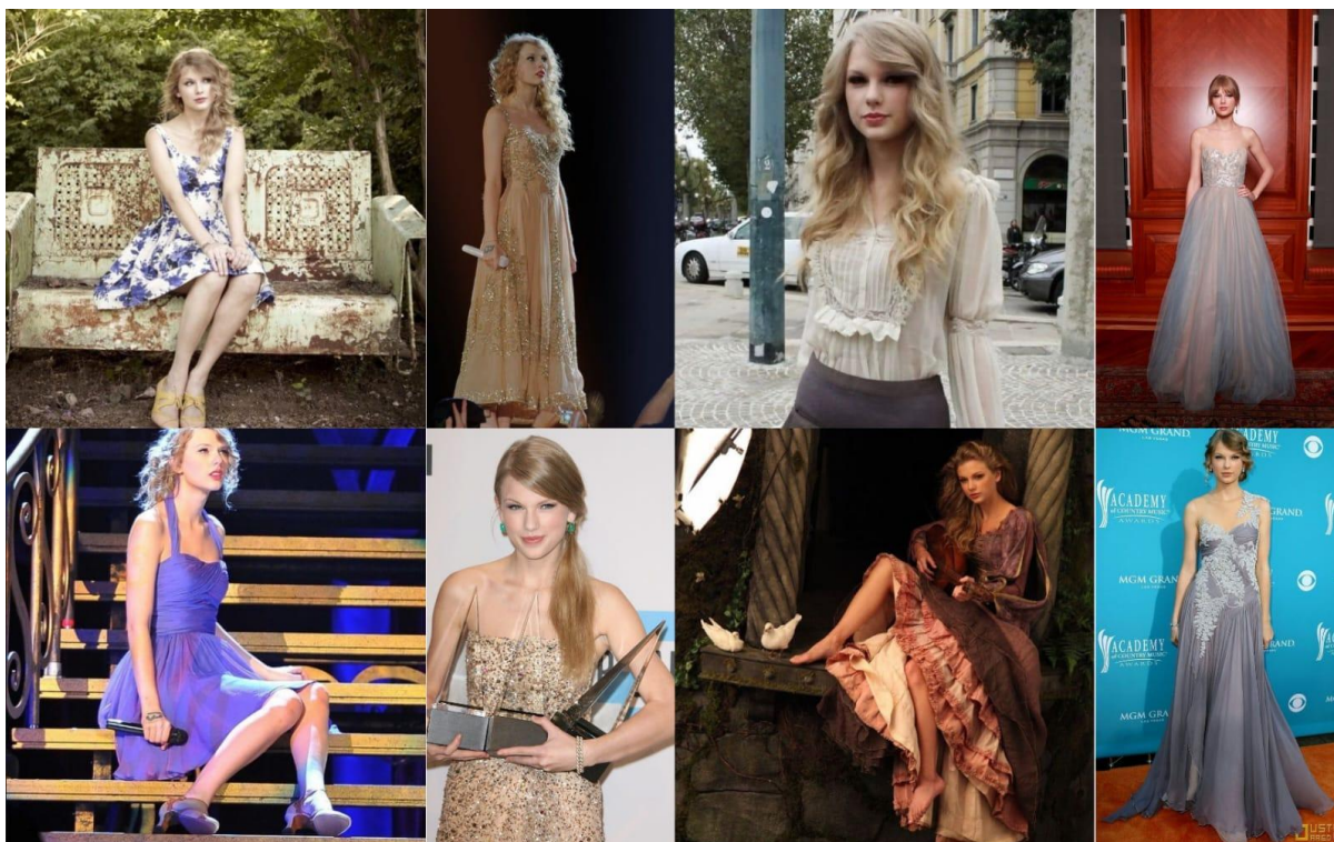
Figura 4 — A Era Fearless

11