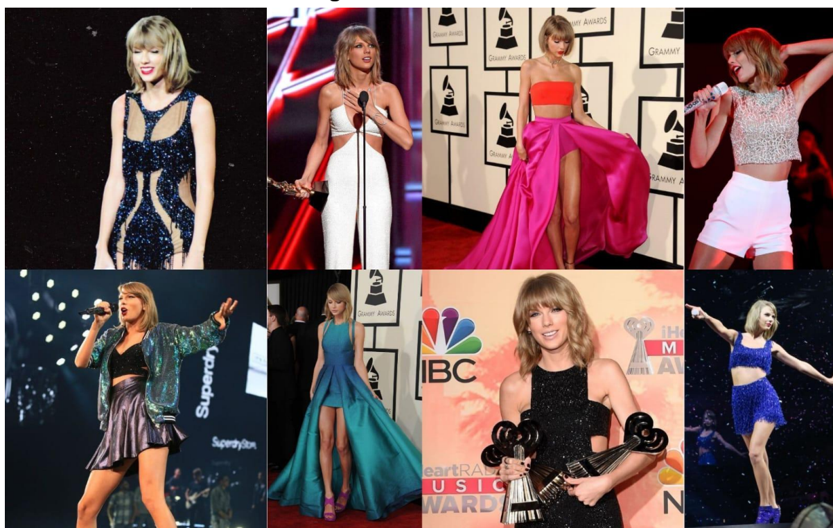
Figura 7 — A Era 1989