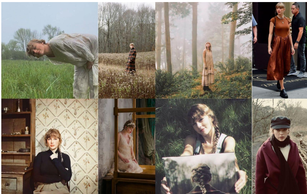
Figura 11 — As Eras Folklore e Evermore

19