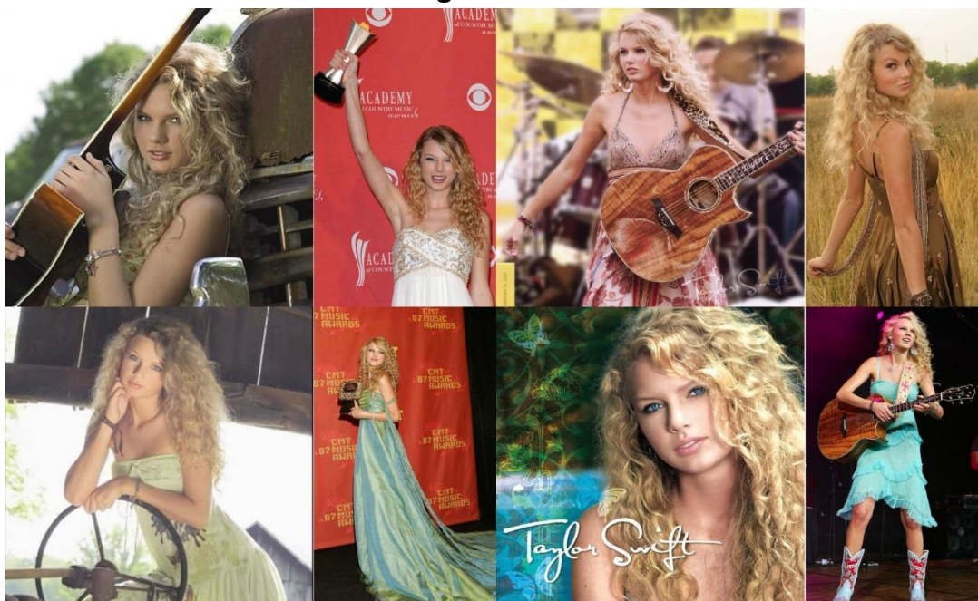
Figura 1 — Era Debut

Fonte: montagem com imagens diversas da internet 6