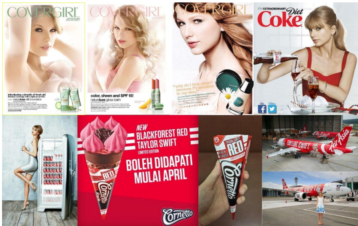
Figura 6 — A influencia de Taylor Swift na Publicidade

Fonte: montagem com imagens diversas da internet 13