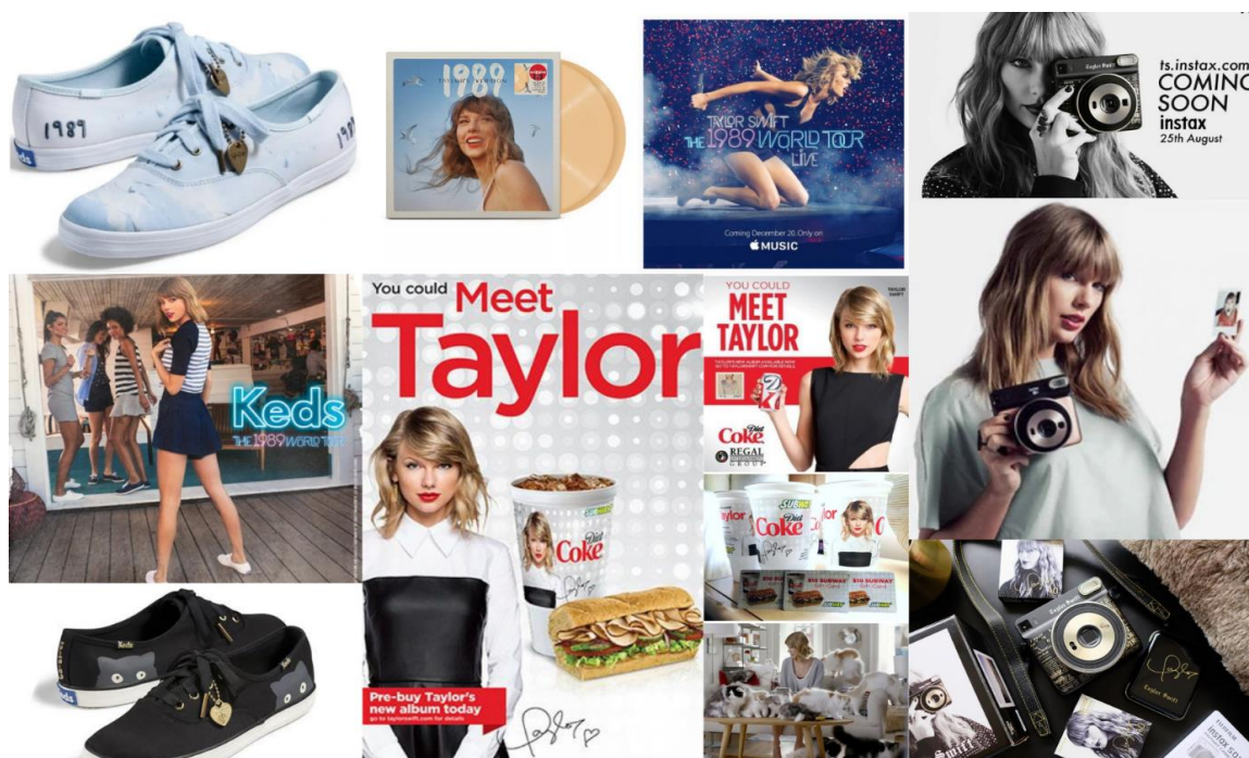
Figura 9 — A influência de Taylor Swift na Publicidade

Fonte: montagem com imagens diversas da internet 16