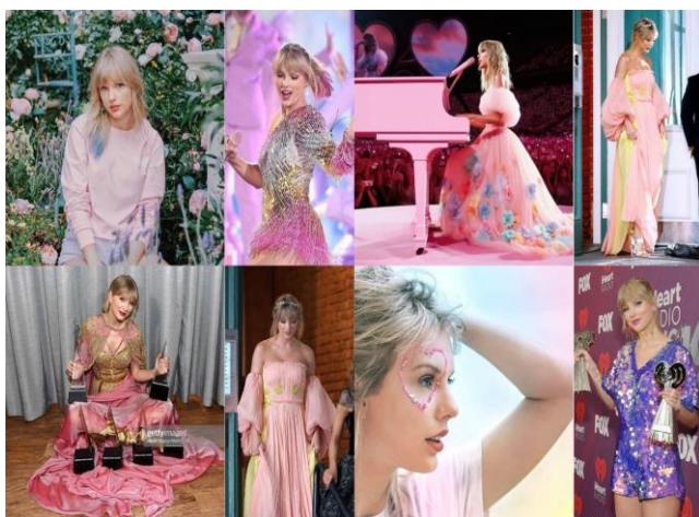
Figura 10 — A Era Lover

18