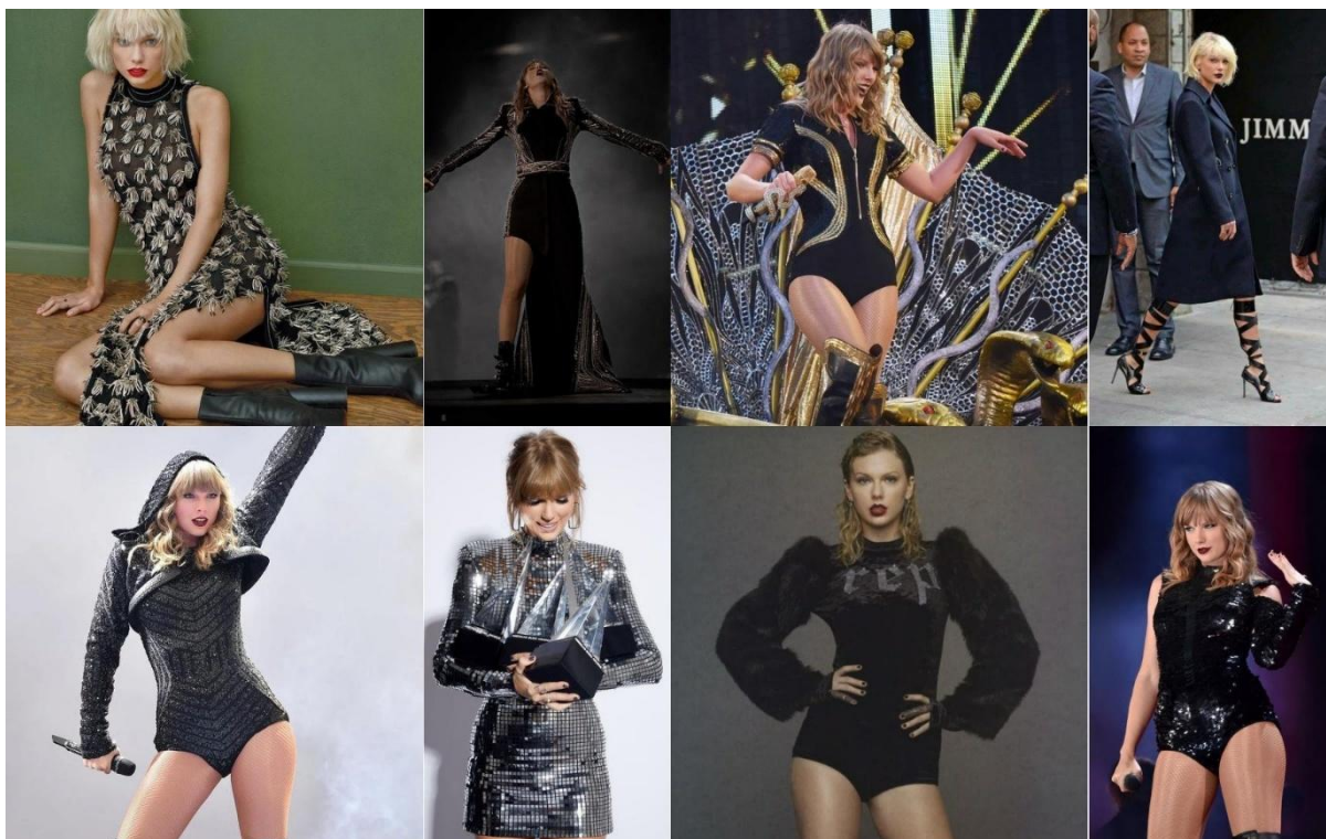
Figura 8 — A Era Reputation

15