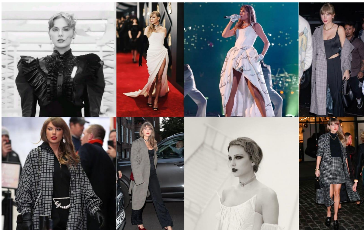
Figura 14 — A Era the Tortured Poets Department

23