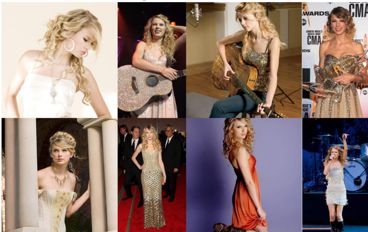
Figura 2 — Era Fearless