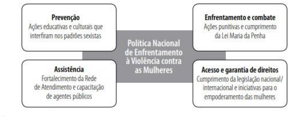
Figura 1: Eixos Estruturantes da Política Nacional de Enfrentamento à Violência contra as Mulheres

Figura 2 – Eixos estruturantes analisados pela Política Nacional de Enfrentamento à Violência contra as Mulheres.