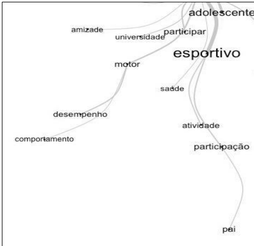
Figura 4: Recorte temático ESPORTIVO

A participação em projetos sociais esportivos promove uma série de benefícios que abrangem atividade, desempenho e comportamento dos adolescentes. As atividades esportivas proporcionam uma plataforma para o desenvolvimento de habilidades físicas, como motricidade progressiva, agilidade, força, equilíbrio e destreza. Segundo Oliveira (2020), atividades esportivas que são estruturadas de forma pedagógica podem ajudar os participantes a adquirir novas habilidades e competências, trazendo benefícios para diversos aspectos, como o motor, social, afetivo e cognitivo.