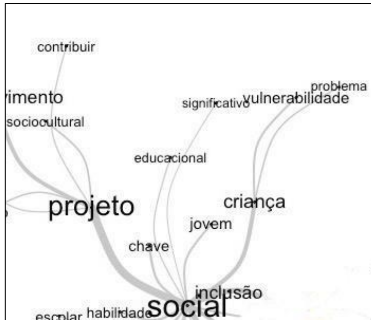
Figura 2: Recorte de campo temático PROJETO SOCIAL

Nesse contexto sociocultural, os resultados destacam o papel fundamental da universalidade do esporte, proporcionando inclusão social e diversidade para adolescentes de diferentes origens socioeconômicas e culturais. Projetos sociais para jovens buscam enfrentar desafios sociais e ambientais, envolvendo jovens de diversas faixas etárias e classes sociais em questões como pobreza, desigualdade, educação, saúde e meio ambiente.