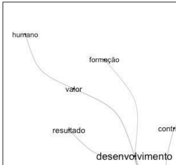
Figura 5: Recorte temático DESENVOLVIMENTO

A participação em projetos sociais esportivos oferece um amplo espectro de benefícios que abrangem o desenvolvimento integral do ser humano envolvido. Através da educação por meio do esporte, os adolescentes não apenas aprimoram suas habilidades motoras, mas também internalizam valores essenciais que são significativamente importantes para sua formação como indivíduos. Como aponta Meireles et al. (2020), desde a infância somos submetidos a novas situações e contextos que nos bloqueiam o desenvolvimento de um repertório de comportamentos sociais que deve ser constantemente ampliado para facilitar nosso convívio em sociedade. Quando as crianças saem do microsistema familiar, começam a se comparar com novas situações que desativam as novas respostas e o desempenho de novos papéis. São diferenças entre as experiências vividas que melhoraram para o desenvolvimento de comportamentos socialmente habilidosos, tais como a participação em esportes organizados.