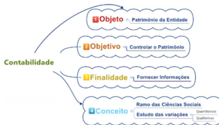
Figura1: Esquema Resumido dos Objetivos da Contabilidade.

A figura 1 traz um esquema que descreve o objeto de estudo, objetivo, finalidade e conceito de contabilidade: