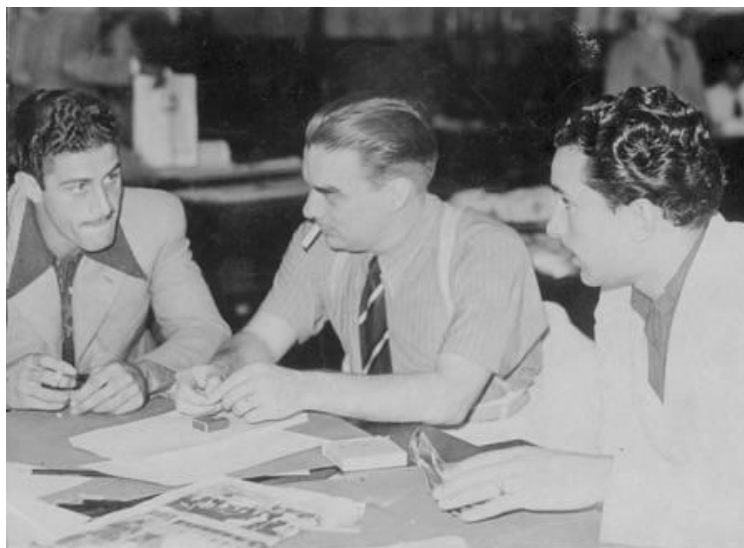
Figura 4: Mario Filho, o “inventor” do jornalismo esportivo, ao centro.