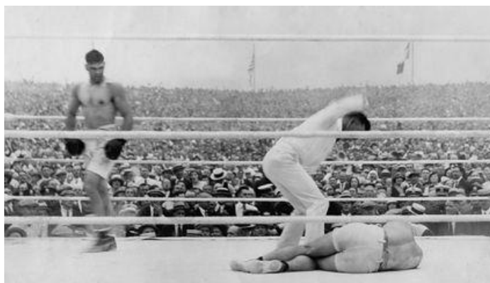
Figura 2: primeira luta de boxe transmitida pela rádio.