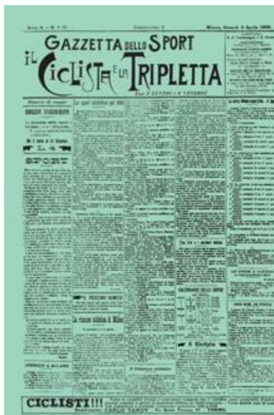
Figura 1: Primeira cópia do La Gazzetta dello Sport .