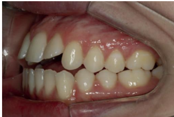
Figura 6 - Fotografia em oclusão do lado esquerdo inicial – Classe I de Angle e Classe II de caninos e sobressaliência aumentada.