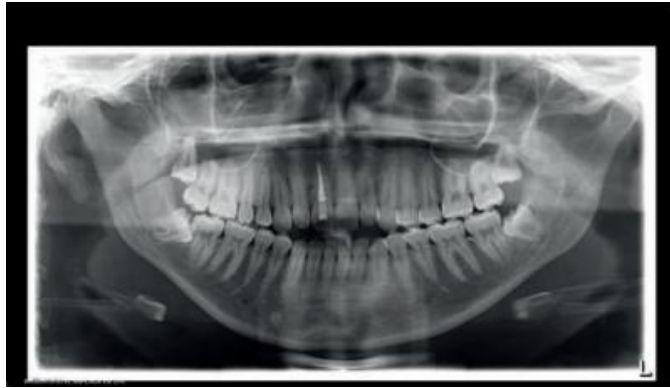
Figura 8 - Radiografia panorâmica inicial – presença dos terceiros molares impactados e tratamento endodôntico do dente 11.