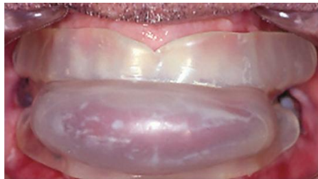
Figura 1 – Língua anteriorizada durante o uso de aparelho retentor de língua

da língua gerada pelo aparelho é o que expande o volume das vias aéreas superiores, além de aumentar a atividade do músculo genioglosso, podendo ser uma condição importante para a diminuição do ronco e das apneias. O dispositivo deve ser recomendado em casos selecionados, preferencialmente em casos de ronco primário e, eventualmente, para SAOS leve, pois o uso do aparelho retentor de língua aponta ter uma adesão menor para os pacientes do que o uso com aparelho de avanço mandibular (CHAVES JUNIOR et al., 2017).