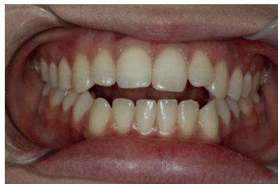
Figura 4 - Fotografia em oclusão de frente inicial – mordida aberta anterior e desvio da linha média inferior para o lado esquerdo.

Maahs et al. em 2020 relataram um caso no qual uma paciente do sexo feminino, com 19 anos a procurou para um tratamento ortodôntico devido à queixa de “desalinhamento dentário”, relatando que dormia com a boca aberta e apresentava baba noturna. Ao exame clínico e radiográfico foi diagnosticado má oclusão de classe II esquelética (figuras 4 a 8).