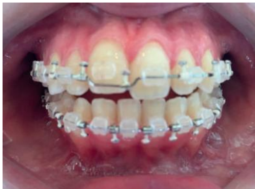
Figura 9 - Fotografia em oclusão de frente pré-operatória e antes de incluir o dente 11 no tratamento.

Maahs et al. relataram que ao exame polissonográfico, a paciente apresentou AOS moderada e não foram encontrados fatores etiológicos obstrutivos do ponto de vista médico. O tratamento consistia em melhorar a oclusão dentária, o desvio mandibular e as funções do sistema estomatognático, além de melhorar o padrão respiratório. Eles planejaram um tratamento ortocirúrgico, iniciado com o alinhamento e nivelamento dos dentes por ortodontia fixa, seguido de cirurgia ortognática. Inicialmente, o elemento 11 não foi incluído devido a trauma na infância e tratamento endodôntico (Figura 9).