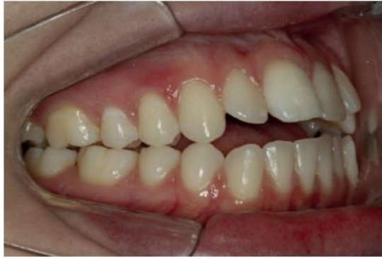
Figura 5 - Fotografia em oclusão do lado direito inicial – Classe III de Angle e de caninos e sobressaliência aumentada.