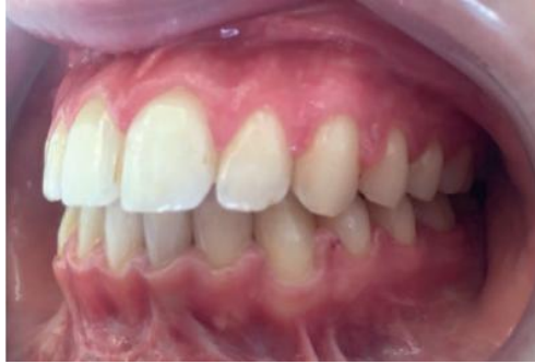
Figura 12 - Fotografia em oclusão do lado esquerdo final – Classe I de Angle e de caninos e sobremordida e sobressaliência adequadas.