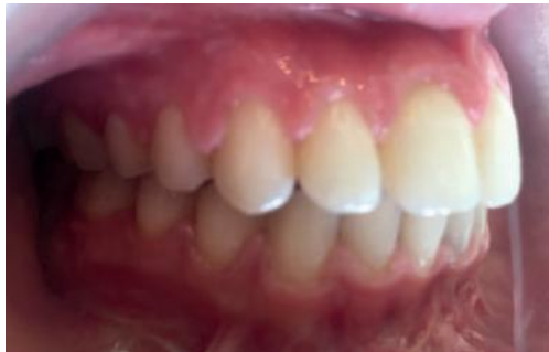
Figura 10 - Fotografia em oclusão do lado direito final – Classe I de Angle e de caninos e sobremordida e sobressaliência adequadas.

da linha média inferior. A impacção foi de 4 mm na região anterior e 2 mm na região posterior. A mandíbula também foi reposicionada à direita para possibilitar a correção da linha média inferior, corrigindo também a assimetria facial. O tempo total de tratamento foi de 1 ano e 7 meses e Maahs relatou que a paciente obteve melhora significativa da respiração e de outras funções do sistema estomatognático. O tratamento foi finalizado em classe I de Angle e de caninos, coincidindo a linha média inferior com a superior, obtiveram-se sobremordida e sobressaliência adequadas e guias corretas de oclusão dinâmica, (Figuras 10 a 12).