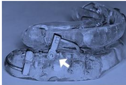
Figura 3 – Exemplo de MAD titulável

progressivamente. São os aparelhos mais indicados no tratamento da SAOS, pois aumentam o volume das vias aéreas superiores através do avanço mandibular (NABARRO et al., 2008). Os aparelhos de avanço mandibular visam garantir que a mandíbula fique em posição avançada enquanto o indivíduo dorme, proporcionando aumento transitório do espaço faríngeo durante o uso do aparelho, dessa forma reduzindo obstruções (Faber, Faber e Faber, 2019).