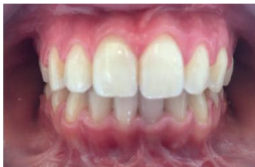
Figura 11 - Fotografia em oclusão de frente final – sobremordida adequada e linhas médias coincidentes.