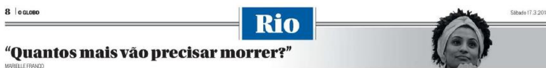
Figura 10: Arte do jornal O Globo para ilustrar matérias sobre Marielle