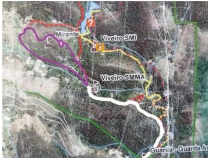
Figura 2: Imagem ilustrativa dos Transectos de Borda (TB) e de Meio (TM). Em branco: Trilha da Pedra (TB) e a estrada Fazenda Santa Cecília (TB); Em roxo: Trilha das Figueiras (TM), a Trilha do Mirante (TM) e a estrada Fazenda Santa Cecília (TM).

No dia 27 de março, mês em que a elaboração da Trilha das Figueiras (TM) se iniciava, iniciou-se as coletas de amostras do presente trabalho, coletando 1 (um) espécime de formigas dentro da Trilha da Pedra (TB) no horário de 10h00min.