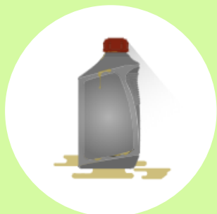
Embalagens plásticas de óleo lubrificante