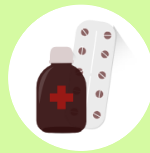
Medicamentos e embalagens