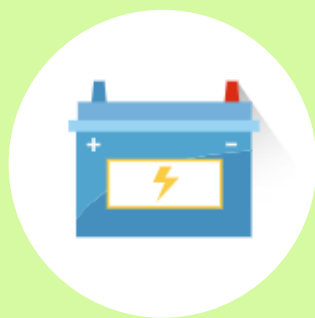
Pilhas e baterias