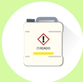
Agrotóxicos, resíduos e embalagens