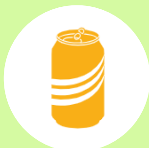
Latas de alumínio para bebidas