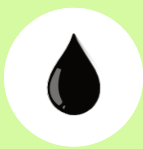
Óleos lubrificantes usados ou contaminados