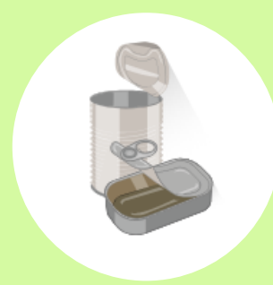
Embalagens em geral e de aço