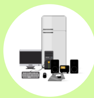
Eletroeletrônicos e componentes