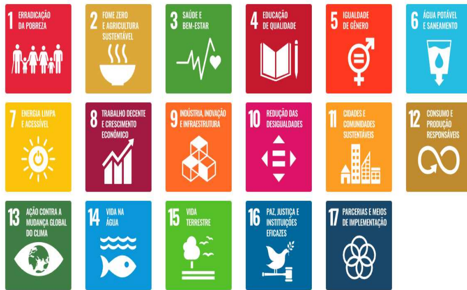
Figura 2 - 17 Objetivos de Desenvolvimento Sustentável