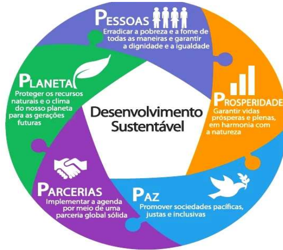
Figura 1 - Desenvolvimento Sustentável (Agenda 2030)