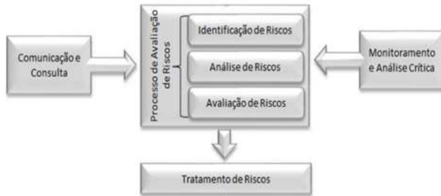
Figura 5 - Metodologia de gestão de Riscos proposta de ISO 31000.