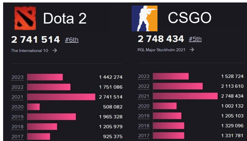
Figura 8 – Telespectadores de Dota 2 e CSGO