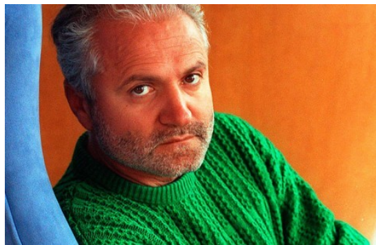
Figura 3: Gianni Versace foi um estilista de alta costura italiano.