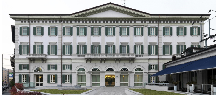
Figura 4: Print do site do Hotel Maison Moschino, situado em Viale Monte Grappa, Milão.