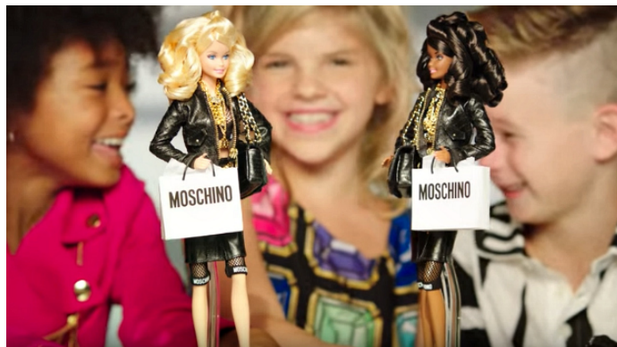
Figura 9: Print do vídeo com as crianças se divertindo com a boneca Barbie