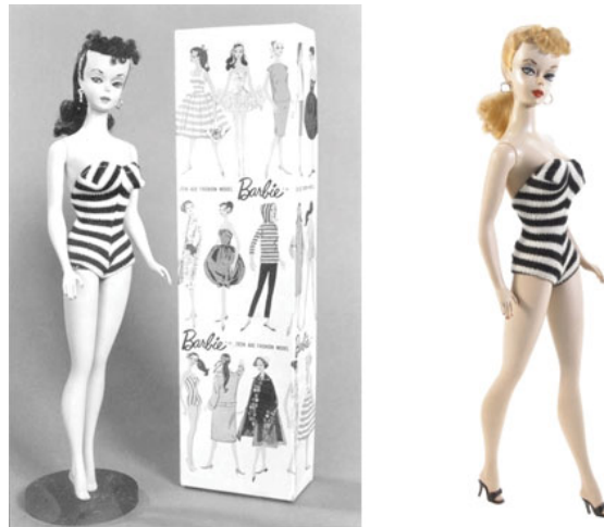
Figura 7: Print do site da primeira Barbie lançada em 1959.