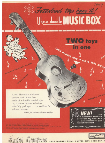
Figura 6: Print do site do Uke-A-Doodle, violão de madeira criado em 1947.