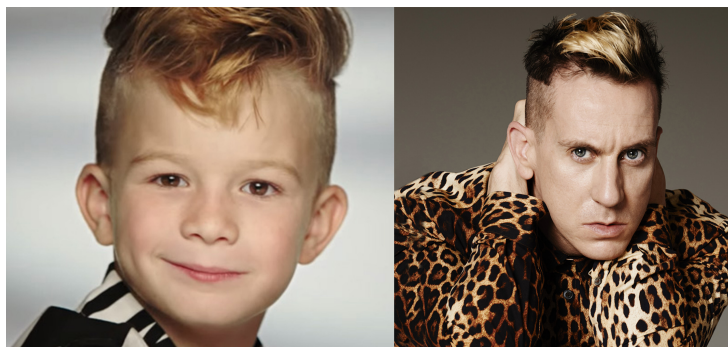
Figura 8: A personificação do personagem infantil de Jeremy Scott, diretor-criativo da grife