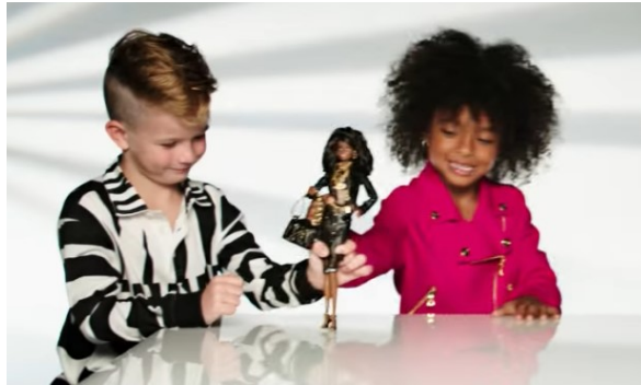
Figura 10: Print do vídeo das crianças interagindo com a boneca Barbie.