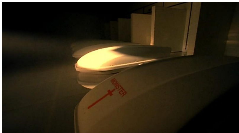
Imagem 2: Cena do clipe “Bad Romance” de Lady Gaga, feixe de luz atingindo a casa de banho.