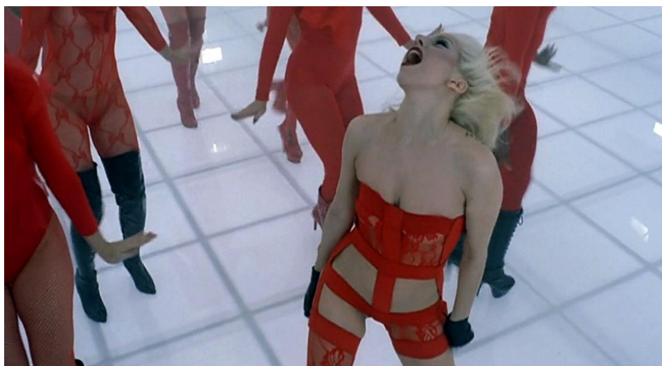
Imagem 17: Cena do clipe “Bad Romance” de Lady Gaga, a personagem de Lady Gaga faz a coreografia com uma expressão agressiva.