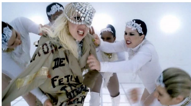
Imagem 8: Cena do clipe “Bad Romance” de Lady Gaga, as mulheres arrancando o casaco da personagem.