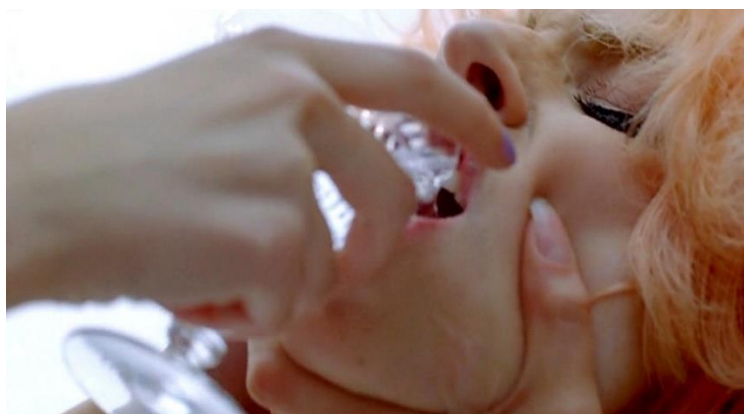
Imagem 6: Cena do clipe “Bad Romance” de Lady Gaga, a personagem é forçada a ingerir a bebida alcoólica.