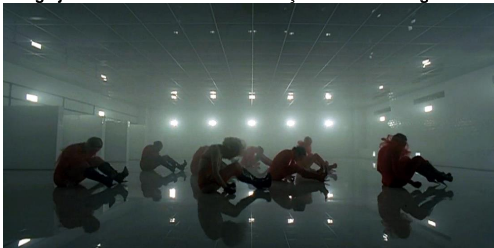
Imagem 15: Cena do clipe “Bad Romance” de Lady Gaga, a personagem de Gaga junto das outras mulheres dançando de forma agressiva.