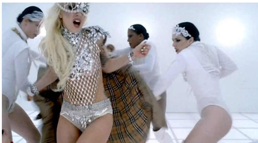
Figura 9: Cena do clipe “Bad Romance” de Lady Gaga, as mulheres deixam a personagem de Gaga seminua.

Fonte: Print Screen do vídeo retirado do YouTube.