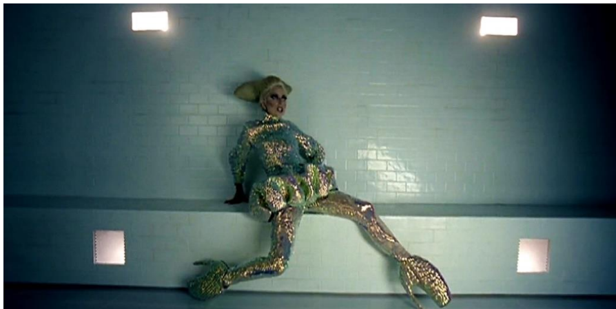
Imagem 13: Cena do clipe “Bad Romance” de Lady Gaga, a personagem da cantora vestida de dourado.