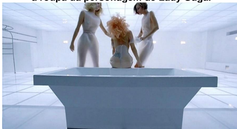
Imagem 5: Cena do clipe “Bad Romance” de Lady Gaga, as mulheres arrancam a roupa da personagem de Lady Gaga.