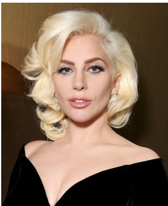
Imagem 1: Lady Gaga na cerimônia de premiação do Golden Globe 2016.