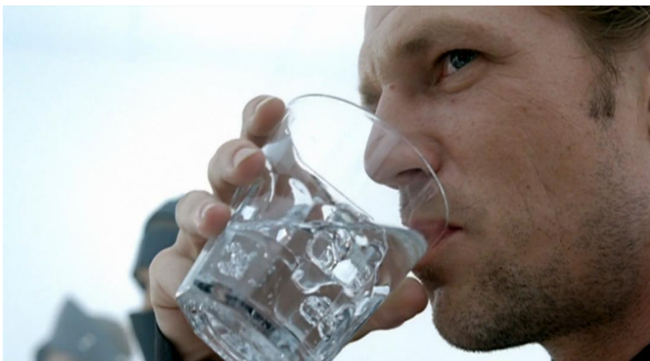
Imagem 19: Cena do clipe “Bad Romance” de Lady Gaga, homem consumindo a vodka.