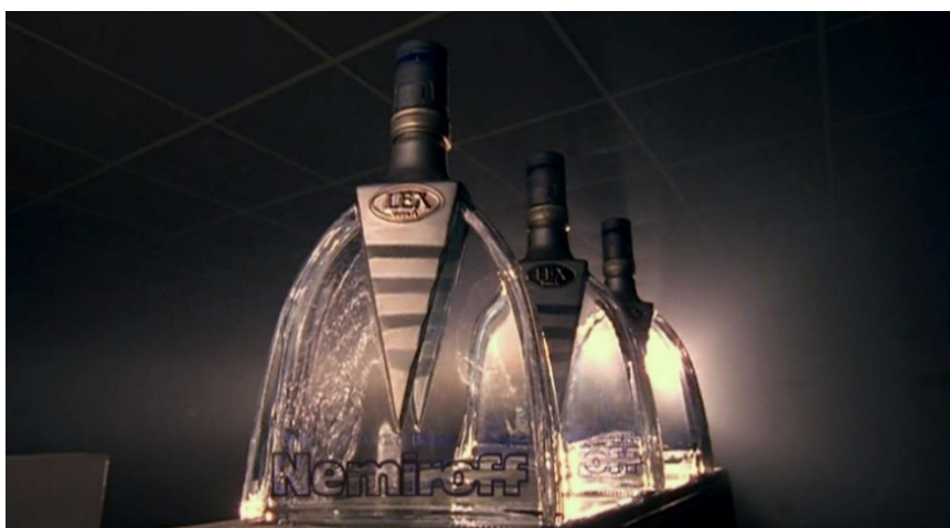
Imagem 18: Cena do clipe “Bad Romance” de Lady Gaga, a bebida alcoólica “Lex Nemiroff” mostrada no início do videoclipe.