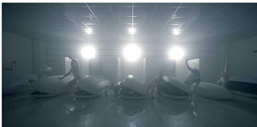
Imagem 3: Cena do clipe “Bad Romance” de Lady Gaga, a personagem de Gaga e as dançarinas saindo de dentro dos caixões brancos.