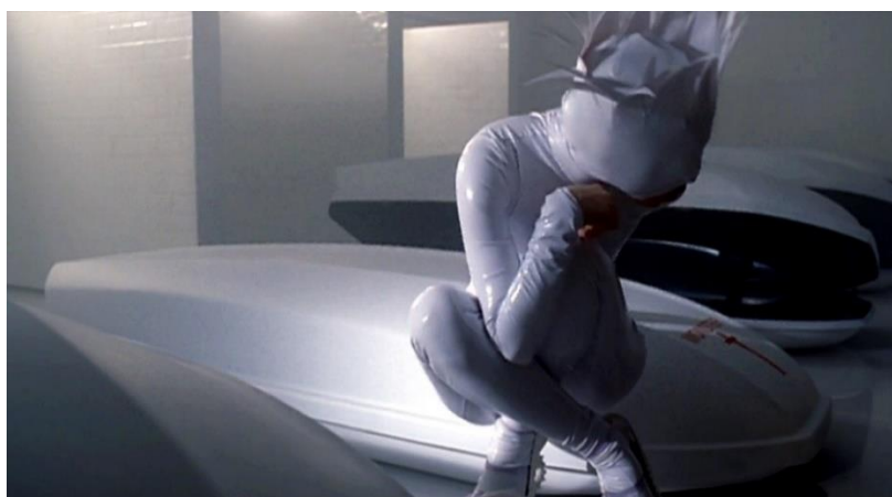
Imagem 4: Cena do clipe “Bad Romance” de Lady Gaga, a personagem da cantora sai do caixão branco da casa de banho.