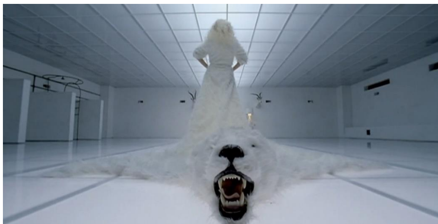
Imagem 14: Cena do clipe “Bad Romance” de Lady Gaga, a personagem caminha lentamente em direção a seu comprador.