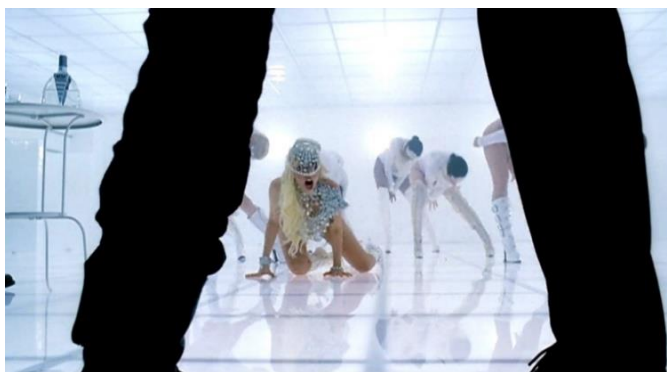
Imagem 10: Cena do clipe “Bad Romance” de Lady Gaga, a personagem de Gaga abaixada olhando assustada para um dos homens.