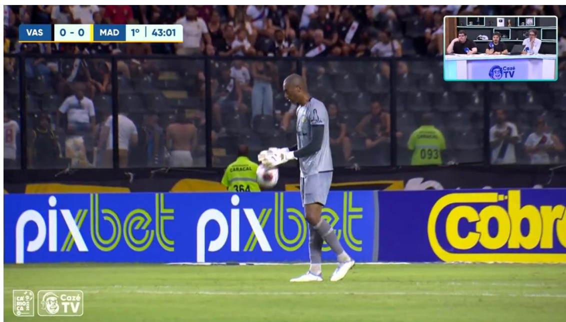
Figura 3: Novo cenário da transmissão

Já na partida entre Vasco da Gama x Madureira, válida pelo Campeonato Carioca de 2023, foi constatado um novo cenário na transmissão, porém com a continuidade da exibição dos narradores e comentaristas.