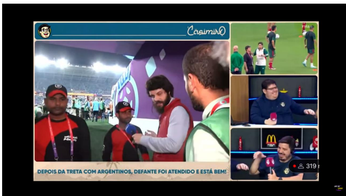
Figura 8: Defante na CazéTV