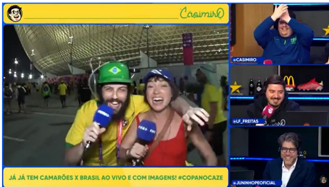
Figura 7: Diogo Defante e Valentina Bandeira em transmissão da Copa do Mundo 2022

Um exemplo disso é a participação do humorista e influenciador Diogo Defante durante as transmissões da Copa do Mundo da FIFA 2022, na CazéTV. As aparições de Diogo aconteciam sempre no pré e pós jogo de cada transmissão, trazendo um conteúdo mais humorístico.