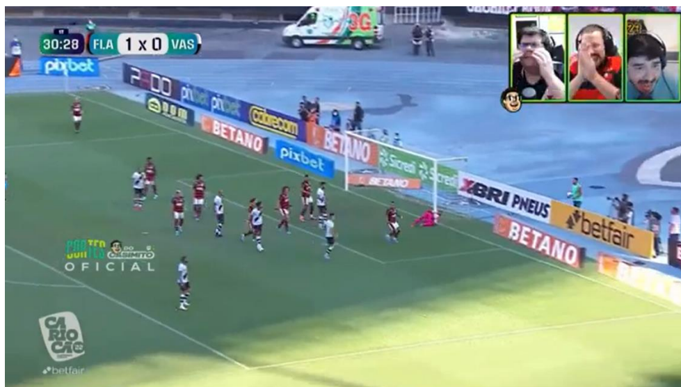
Figura 1: Reação dos envolvidos na transmissão de Flamengo x Vasco

camisas dos clubes ao qual torcem, além disso foi observado que eles vibravam a cada lance de perigo ou gol do seu time.