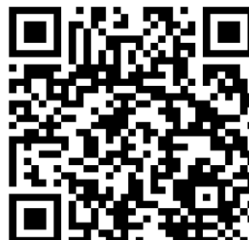
Figura 9: QR Code com vídeo de entrevista do Richarlison

Em síntese, a análise dos resultados indica que a Cazé TV atrai o público ao oferecer uma experiência que combina autenticidade, interatividade e acessibilidade. A plataforma, ao valorizar a participação do espectador e ao promover um ambiente de comunidade, destaca-se como um modelo disruptivo, que redefine a forma como o futebol é consumido no Brasil. Essa transformação aponta para um cenário de crescente relevância do streaming no mercado de mídia esportiva, consolidando a Cazé TV como um caso exemplar de inovação e de resposta às novas demandas de um público digital, engajado e participativo.