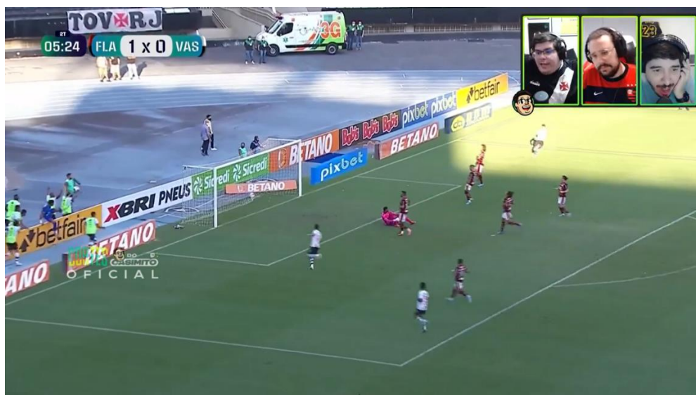
Figura 2: Casimiro comemorando gol do Vasco