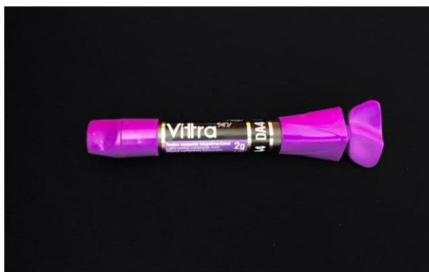
Figura 3.4: Resina Composta Vittra APS – FGM, Dentina.

A resina convencional foi inserida em dois incrementos, com fotoativação por 20 segundos a cada incremento com o fotopolimerizador (Valo) (figura 3.5). As restaurações receberam acabamento com pontas diamantadas de granulação fina nº 3118F (KG Sorensen) em alta rotação, com irrigação ar/água, e o polimento foi realizado com discos de diferentes granulações (Diamond FGM) (figura 3.6) e taças de carbeto de silício (American Burs). Estas restaurações foram imersas em água destilada a 37 °C, por 24h.