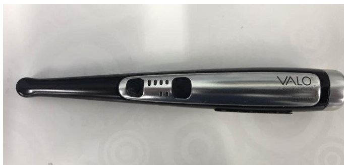
Figura 3.5: Fotopolimerizador Valo