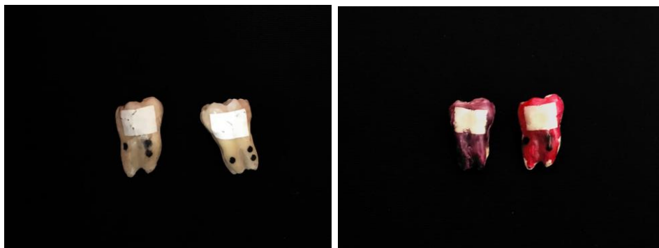
Figura 3.7 e 3.8: Preparos vedados e com duas camadas de esmalte.

A seguir, as amostras foram imersas em solução de Azul de metileno (figura 3.9), por 7 dias e depois lavadas em água corrente por 10 minutos. Para determinação da penetração do corante, os espécimes foram cortados com a cortadora metalográfica de precisão (IsoMet 1000 – PRECISION SAW) (figura 3.10 e 3.11). Os cortes seguiram o sentido méso-distal a partir do centro da restauração com distância de 1mm.