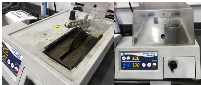
Figura 3.10 e 3.11: Cortadora metalográfica de precisão (IsoMet 1000)

Foram avaliados o fator “PROTOCOLO ADESIVO” (convencional vs. autocondicionante) e o fator “MARGEM EM ESMALTE E DENTINA”. Com isso, foram geradas quatro interfaces para leitura, as quais foram avaliadas por um examinador calibrado, sob aumento de 10x em microscópio óptico (Carl Zeiss), conforme os escores previamente estabelecidos para a determinação do grau de infiltração na parede gengival das restaurações, com margens em esmalte/dentina/cimento. Os dados foram submetidos ao teste não-paramétrico de Tukey, com nível de significância de 5%.