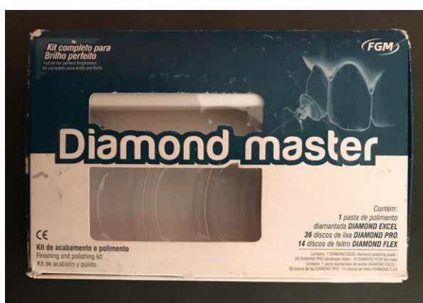
Figura 3.6: Kit de acabamento e polimento Diamond Master (FGM).

Na sequência, as amostras tiveram seus ápices vedados com resina composta convencional para prevenir a penetração do corante na porção interna do dente. As superfícies dos dentes foram secas e cobertas com duas camadas de esmalte (figura 3.7 e 3.8) de unha, com intervalo de 20 minutos a cada aplicação, de modo a garantir o isolamento seguro de todo o dente, a fim de evitar a penetração do corante em áreas de microfissuras ou defeitos estruturais que não foram observados durante a seleção dos dentes. Com exceção de uma área de 1,0mm, coberta com fita ao redor da interface adesiva da restauração, avaliada com sonda milimétrica. Desta maneira, restringindo a penetração do corante às margens da cavidade.