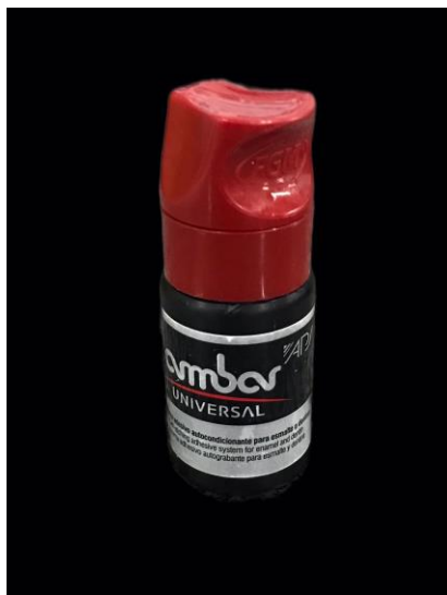
Figura 3.3: Sistema Adesivo Universal Ambar APS – FGM.