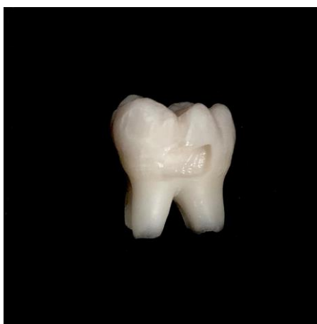
Figura 3.1:Uma cavidade preparada em face vestibular.

Nos dentes foram preparadas cavidades padronizadas, sendo 1 cavidade na superfície vestibular (figura 3.1) e 2 na palatina/lingual (figura 3.2) com brocas diamantadas nº 1090 e nº1014 (KG Sorensen) em alta-rotação, sob constante refrigeração. As brocas foram trocadas após cada 5 preparos. As cavidades seguiram as seguintes dimensões: 2mm de profundidade, 2mm de extensão méso-distal e 2 mm de extensão ocluso-cervical e com margens gengivais localizadas 1 mm abaixo da JCE. As dimensões de cada cavidade foram confirmadas com um paquímetro digital.