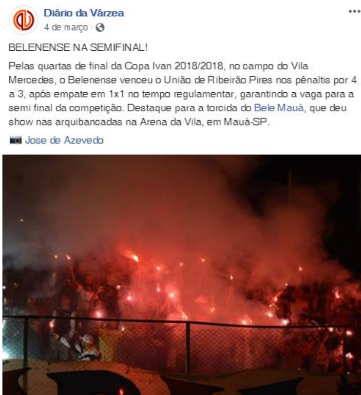
Figura 7 - Festa da torcida do Belenense pela classificação