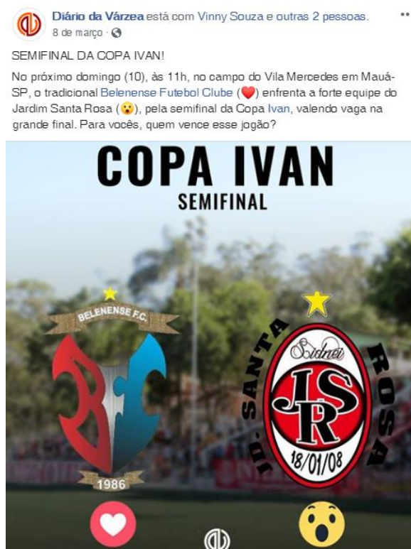
Figura 3 - Enquete realizada pela Fanpage