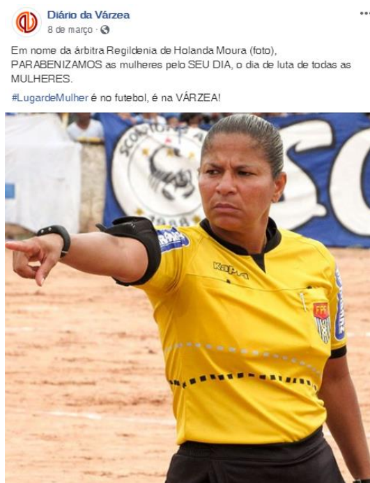
Figura 1 - Post especial em homenagem ao dia Internacional da mulher