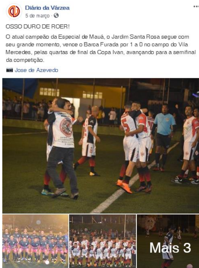
Figura 5 - Cobertura de uma decisão da Copa Ivan, importante torneio da Grande São Paulo