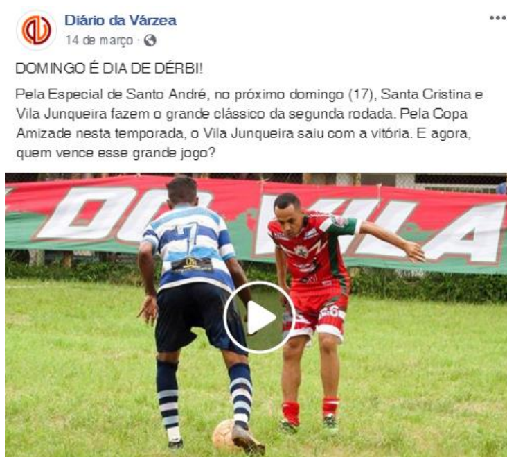
Figura 4 - Exemplo de compilado produzido pela fanpage