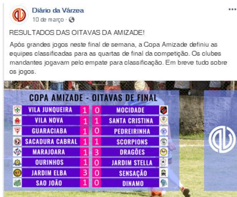
Figura 2 - Informativo com resultados de um campeonato