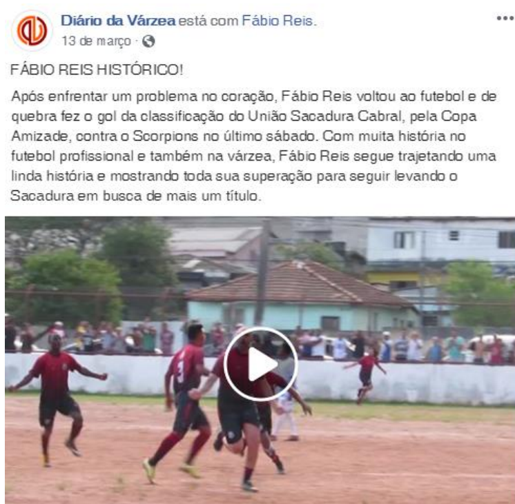
Figura 6 – Notoriedade, personalização e dramatização combinados na fanpage