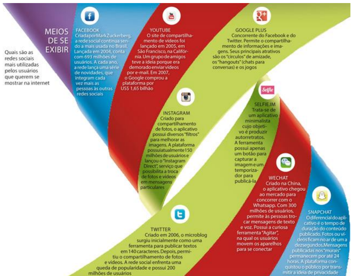
Figura 1: Meios de se exibir, 2016.