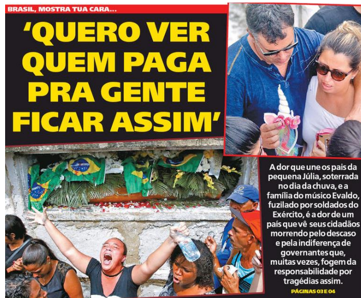
Figura 11: título e subtítulo do jornal Meia Hora publicado dia 11 de abril.