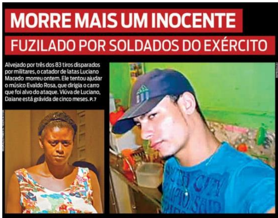
Figura 19: título e subtítulo do jornal O Dia publicado dia 19 de abril.