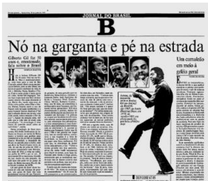
Figura 1: Caderno B, o pioneiro no desenvolvimento de segmentação no jornalismo impresso brasileiro