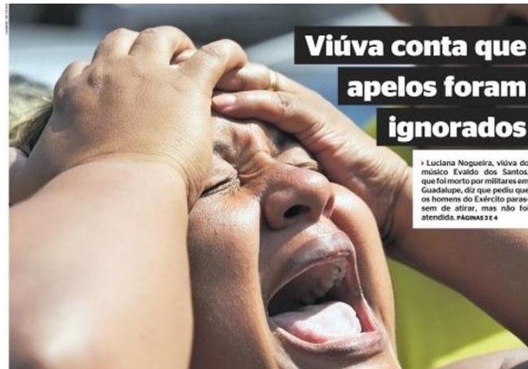
Figura 6: título e subtítulo do jornal Extra publicado dia 9 de abril.