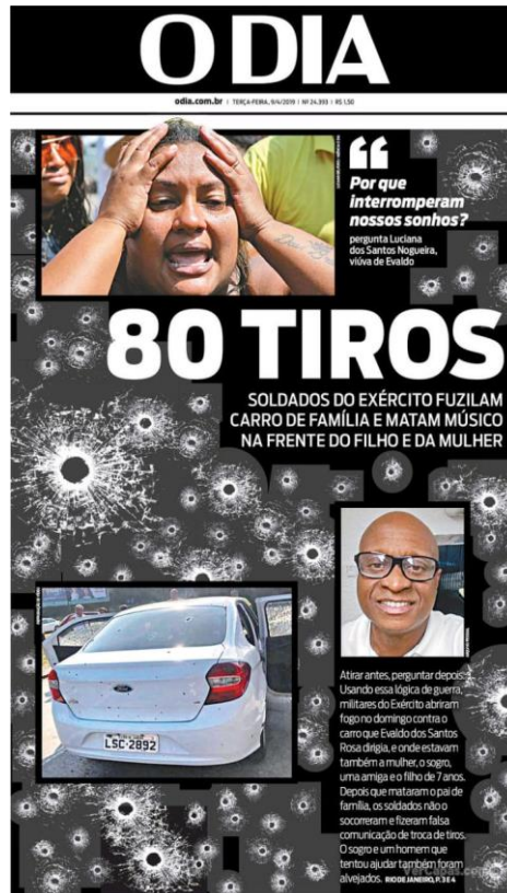
Figura 8: título e subtítulo do jornal O Dia publicado dia 9 de abril.