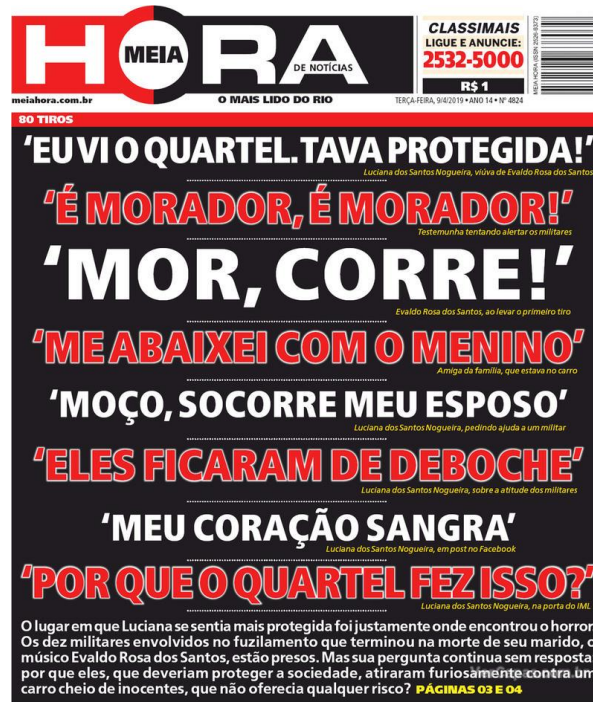
Figura 7: título e subtítulo do jornal Meia Hora publicado dia 9 de abril.