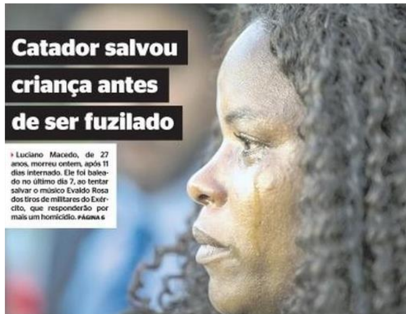
Figura 17: título e subtítulo do jornal Extra publicado dia 19 de abril.