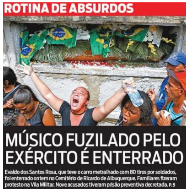
Figura 12: título e subtítulo do jornal O Dia publicado dia 11 de abril.