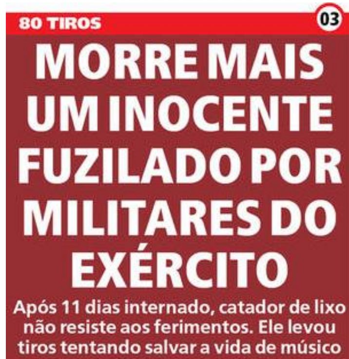
Figura 18: título e subtítulo do jornal Meia Hora publicado dia 19 de abril.