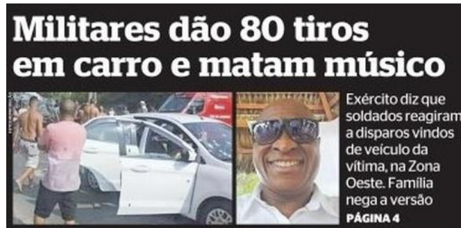
Figura 2: título e subtítulo do jornal Extra publicado dia 8 de abril.