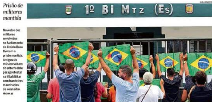
Figura 13: título e subtítulo do jornal O Globo publicado dia 11 de abril.