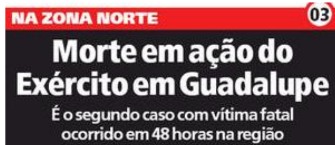
Figura 3: título e subtítulo do jornal Meia Hora publicado dia 8 de abril.