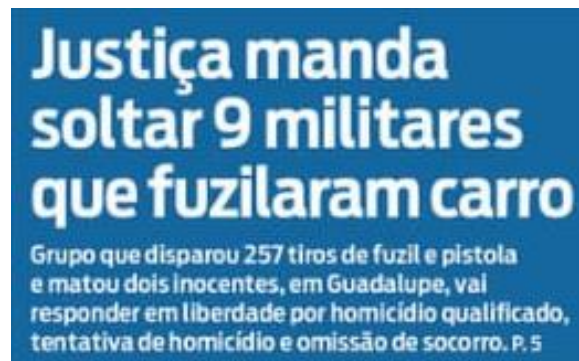
Figura 22: título e subtítulo do jornal O Dia publicado dia 24 de maio.