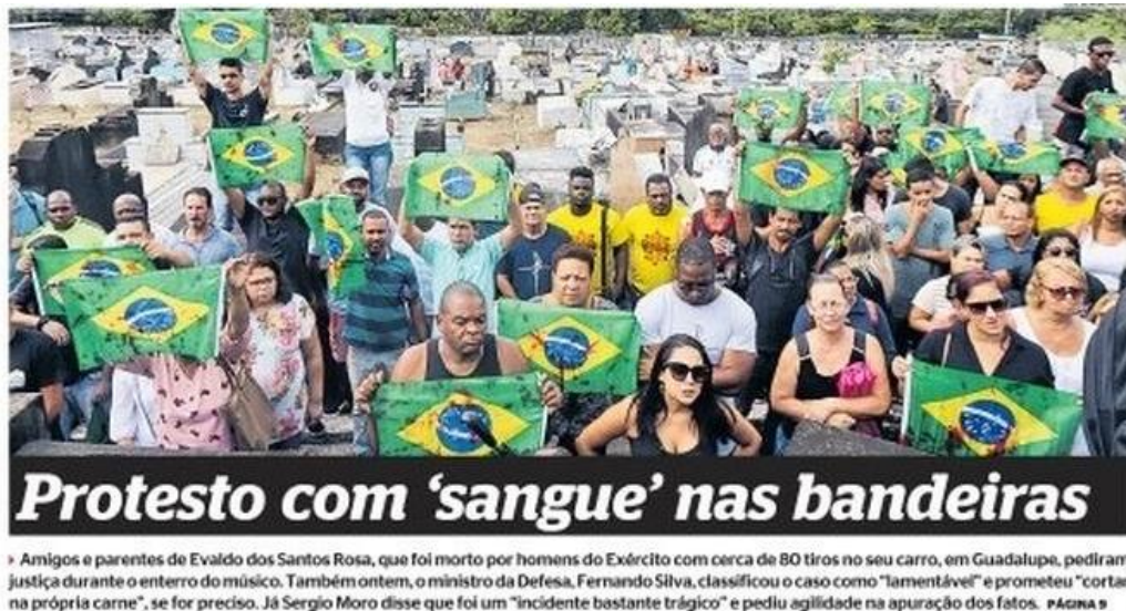
Figura 10: título e subtítulo do jornal Extra publicado dia 11 de abril.