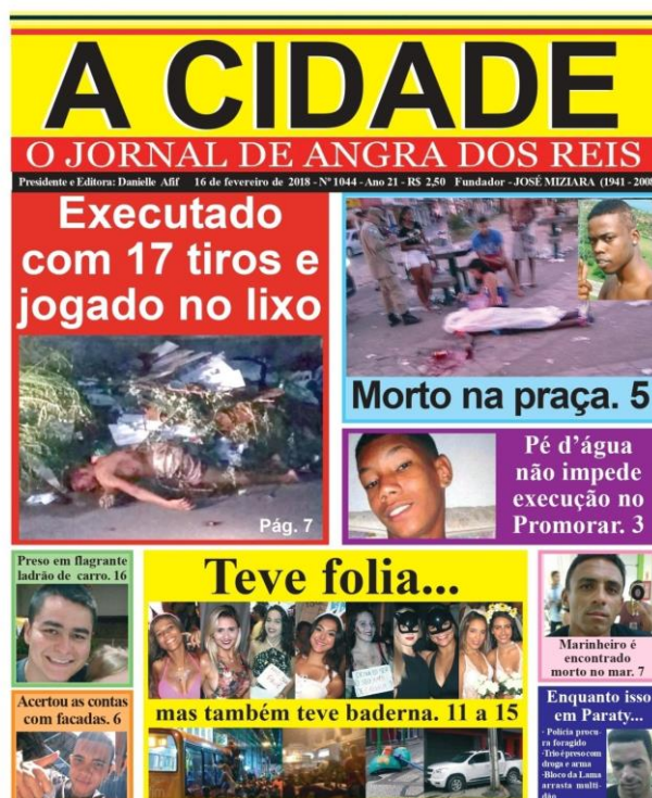
Figura 6: capa 16 de fevereiro de 2018.