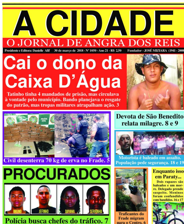
Figura 12: capa 30 de março de 2018