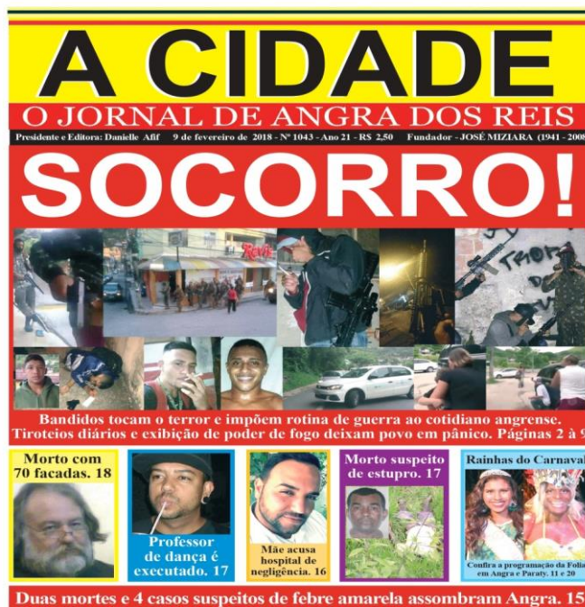
Figura 5: capa de 2 de fevereiro de 2018.