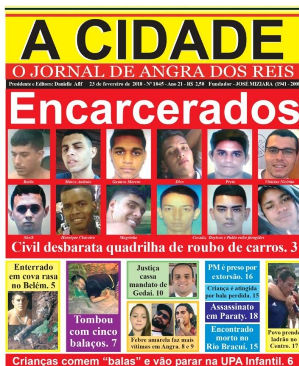
Figura 7: capa 16 de fevereiro de 2018.