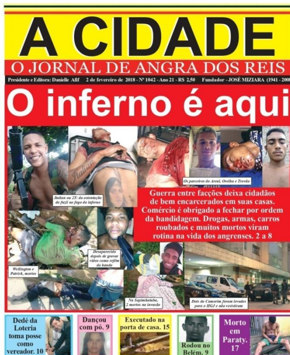
Figura 4: capa de 2 de fevereiro de 2018.