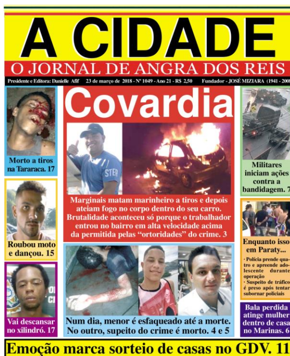
Figura 11: capa 23 de março de 2018.