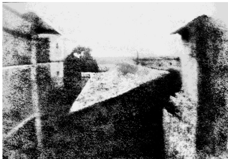
Figura 2: A vista da janela em Le Gras

Figura 2: Vista da Janela em Le Gras; Fonte: https://www.incinerrante.com/textos/vista-da-janela-em-le-gras-1826-7-de-joseph-nicephore-niepce