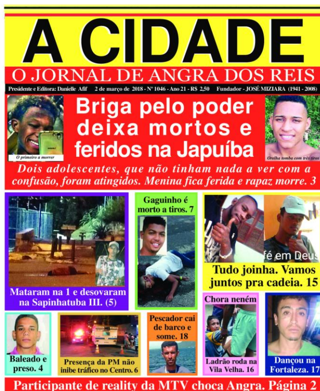
Figura 8: capa 2 de março de 2018.

A capa a seguir, ainda apresenta da mesma linguagem visual se tratando das anteriores, o que se percebe é que a cor vermelha comumente é direcionada a assuntos de crimes que resultaram em mortes. A edição do dia 2 de março de 2018 apresenta ainda cenários devastados pela criminalidade. Ao se tratar do caso escolhido para a manchete principal em que dois adolescentes se tornam vítimas fatais, ocasionado pela briga de poder de duas possíveis facções, é possível observar que dentre as manchetes escolhidas para a capa, três se tratam de assassinato, cujo crime ocasionou em quatro vítimas.