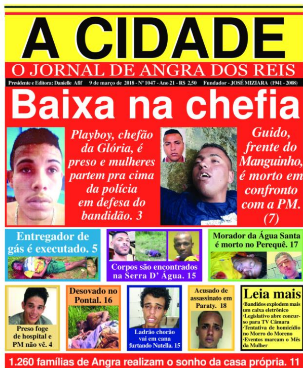
Figura 9: capa 9 de março de 2018.