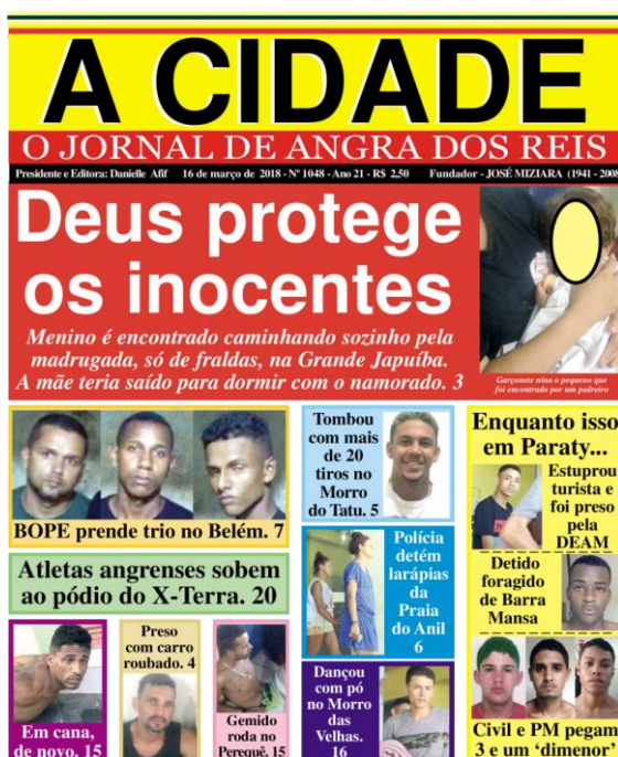
Figura 10: capa 16 de março de 2018.