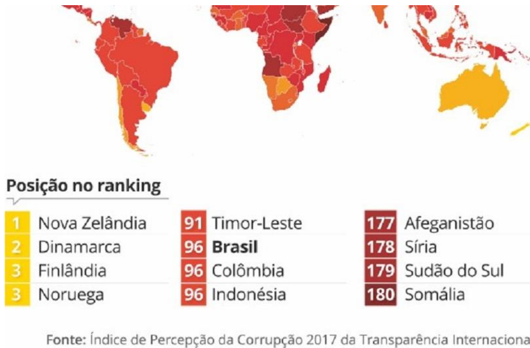
Figura 2: Posição no ranking de percepção da corrupção global, 2017.