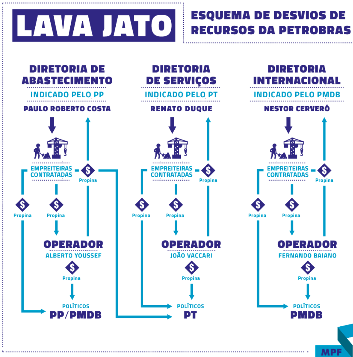
Figura 3: Esquematização dos desvios na Petrobras, 2017.