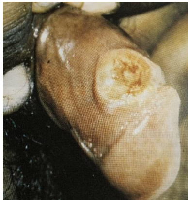
Figura 3: Cancro duro da forma primária da sífilis na região peniana