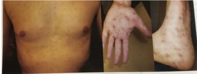
Figura 4: Lesões cutâneas em tronco, mãos e pés da forma secundária da sífilis