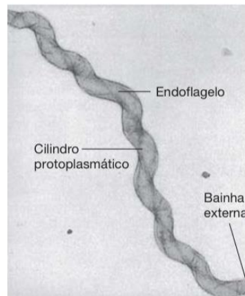
Figura 2: Ilustração do Treponema pallidum

A sífilis é causada por um gênero de espiroqueta chamada Treponema pallidum , que é uma bactéria Gram-negativa. São microrganismos espiralados finos com um corpo celular recoberto por uma membrana citoplasmática trilaminar com endoflagelos acoplados nas extremidades da célula que auxiliam seu movimento em espiral. Além da sífilis, este gênero transmite outras doenças, porém o Treponema Pallidum é o único agente etiológico que tem o ser humano como seu hospedeiro natural. (LEVINSON, 2010; MADIGAN et al, 2016; JAMESON, 2020).