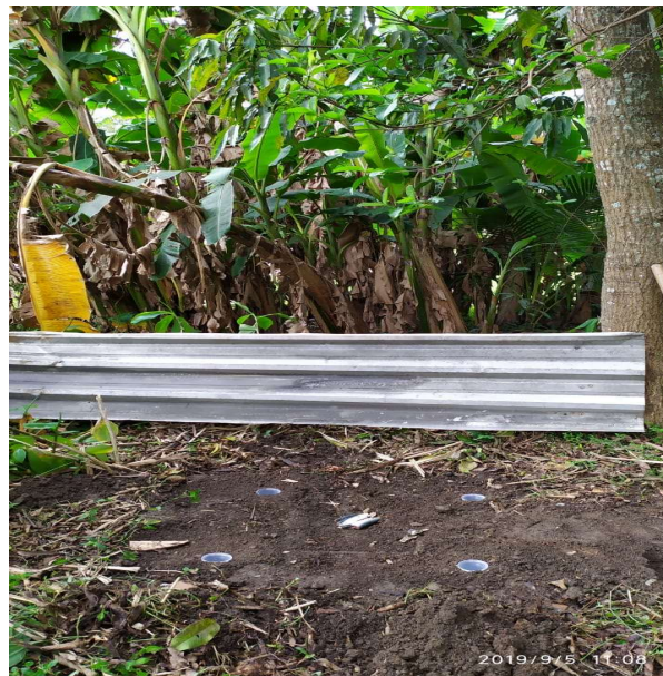
Figura 2 – Terreno onde foi realizado o estudo, localizado no bairro Saudade em Barra Mansa, Rio de Janeiro