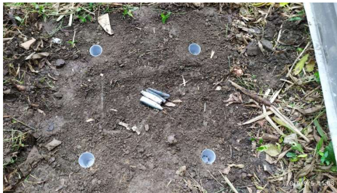
Figura 4 – Objetos colocados em cima das armadilhas para fazer peso e impedir que animais se alimentasse da carcaça.