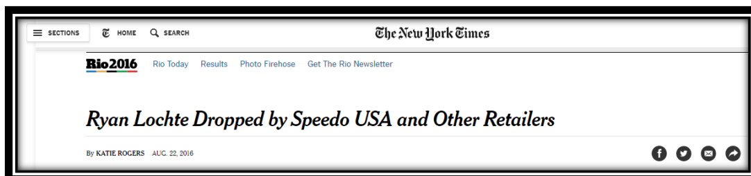
Figura 11: Título americano publicado em 22 de agosto