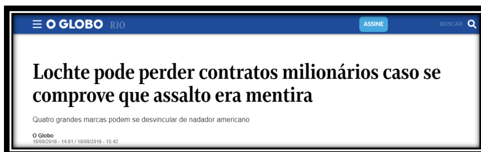
Figura 8: Segundo título brasileiro publicado em 18 de agosto