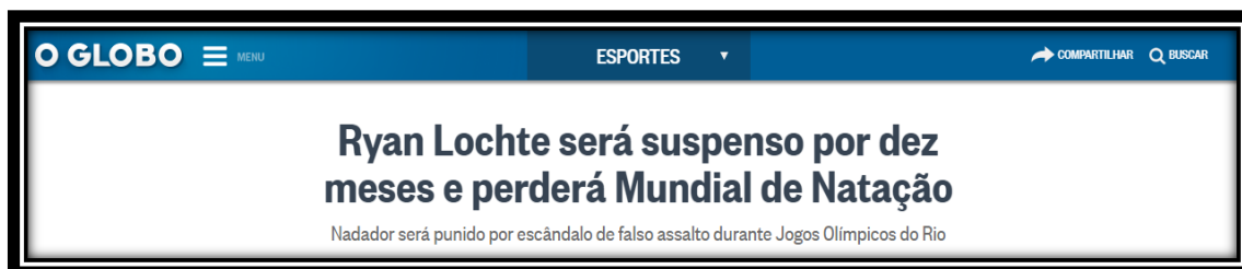
Figura 16: Título brasileiro publicado em 8 de setembro