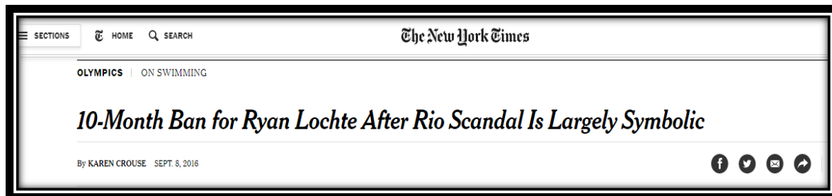
Figura 15: Título americano publicado em 8 de setembro