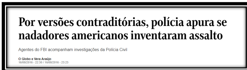
Figura 3: Título brasileiro publicado em 16 de agosto