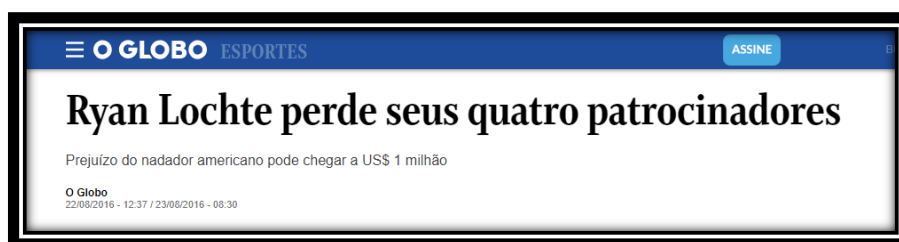
Figura 12: Título brasileiro publicado em 22 de agosto