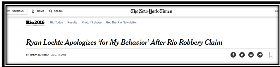
Figura 9: Título americano publicado em 19 de agosto