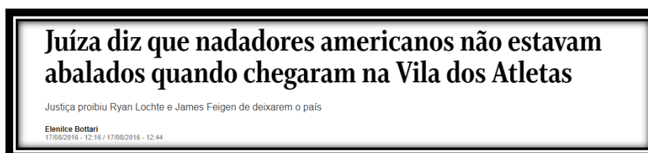
Figura 5: Título brasileiro publicado em 17 de agosto