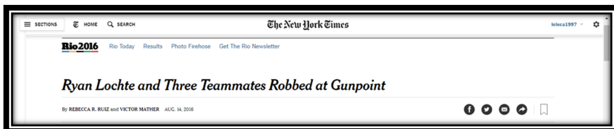
Figura 1: título americano publicado dia 14 de agosto