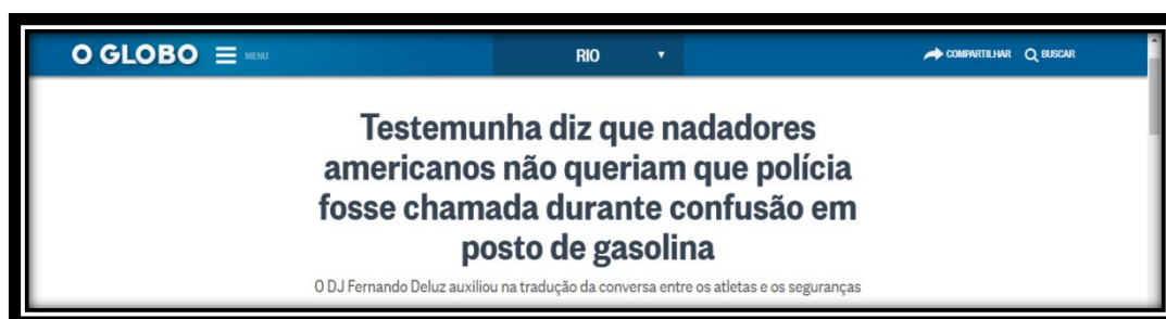
Figura 7: Título brasileiro publicado em 18 de agosto