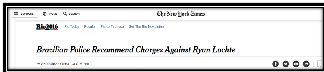
Figura 13: Título americano publicado em 25 de agosto