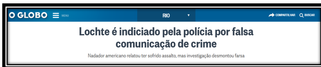
Figura 14: Título brasileiro publicado em 25 de agosto