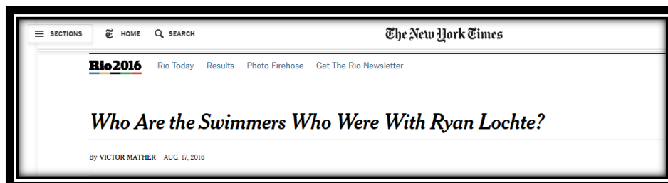
Figura 4: Título americano publicado em 17 de agosto

Fonte: Site do The New York Times . Disponível em < https://www.nytimes.com/2016/08/18/sports/olympics/ryan-lochte-jimmy-feigen-gunnar-bentz-jack-conger.html >