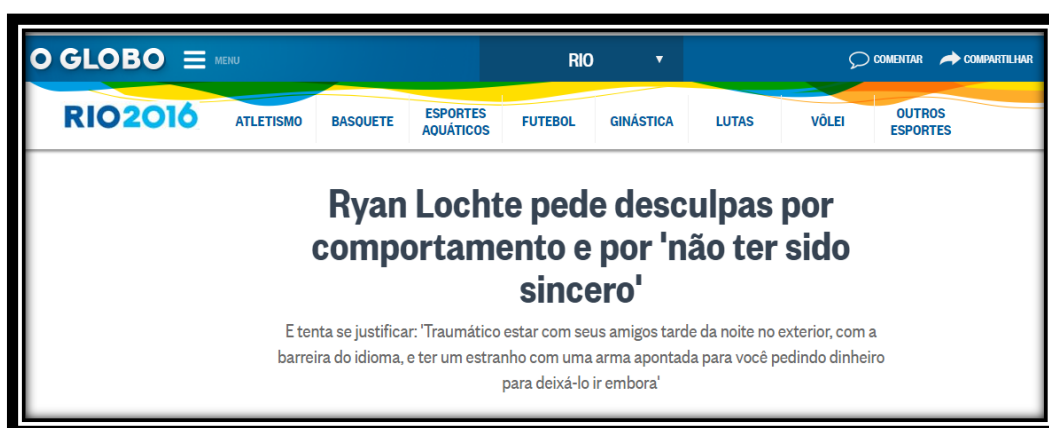
Figura 10: Título brasileiro publicado em 19 de agosto