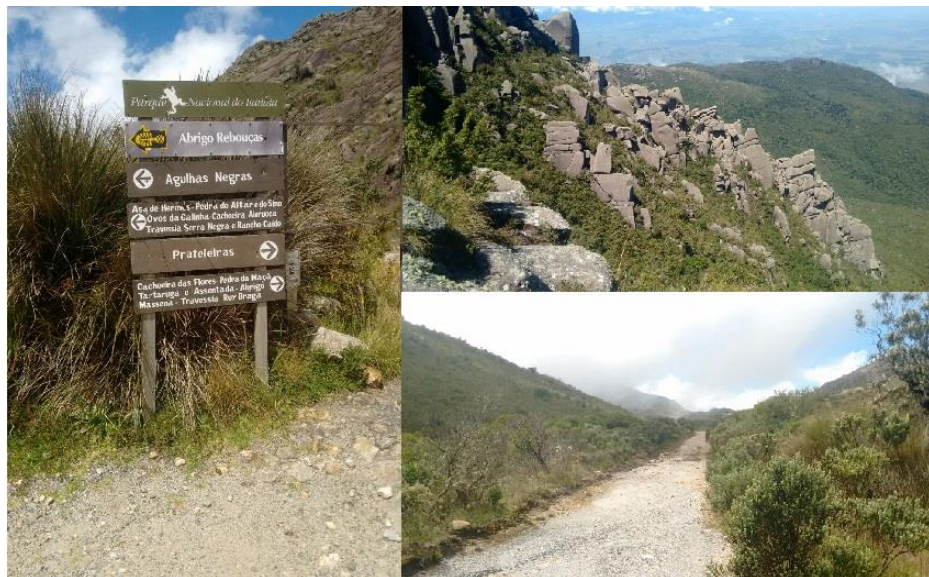
Figura 1: Parque Nacional de Itatiaia, Rio de Janeiro.

A coleta foi realizada no Parque Nacional do Itatiaia (22°22'S 44°40'W) que está situado entre os municípios de Resende e Itatiaia no Estado do Rio de Janeiro (Figura 1). Prateleiras do Itatiaia (PI); Morro do Couto (MC); Abrigo Rebouças (AR) e Pico das Agulhas Negras (AN). Em cada uma das quatro áreas escolhidas para o estudo foram demarcadas três parcelas de 30 X 30 metros equidistantes 200 metros. O clima da região apresenta dois tipos: nas regiões elevadas, acima dos 1.600m de altitude, mesotérmico com verões brandos e chuvosos, enquanto nas regiões baixas das encostas serranas predomina o mesotérmico com verões brandos, mas sem uma estação seca definida. As temperaturas médias anuais são 20 a 22°C, máxima absoluta de 36 a 38°C e mínima absoluta de 0 a 4°C e o relevo é montanhoso, a precipitação anual varia de 1967 a 3037 mm, com média de 2429mm. Cerca de 80% das chuvas concentram-se de outubro a março. As temperaturas podem chegar até 10°C, com média anual de 14,4°C. Os meses mais frios concentram-se entre maio e agosto, quando ocorre maior insolação (SEGADAS-VIANA & DAU, 1965).