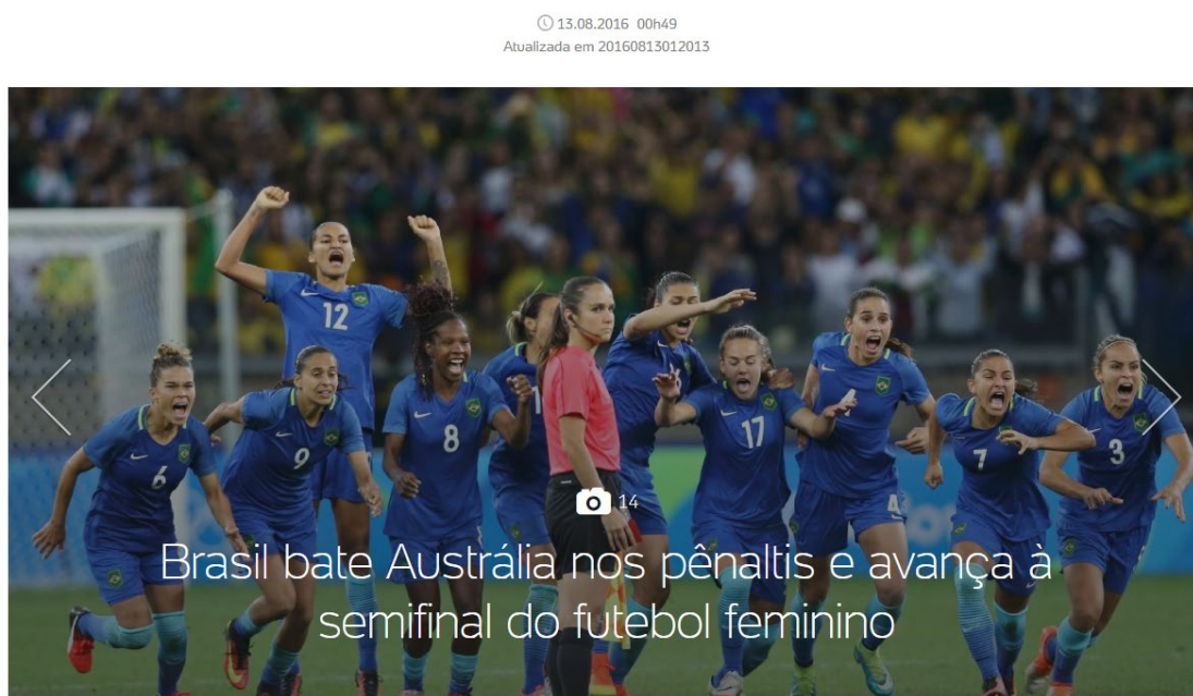
Figura 1: Notícia da seleção feminina

O portal selecionado para a análise deste trabalho é o UOL Esportes e durante a seleção do material, foi possível perceber que diversas notícias ao invés de exibirem o texto nos moldes jornalísticos, utilizavam somente fotografias ou vídeos com breves legendas, conforme ilustra a Figura 1.