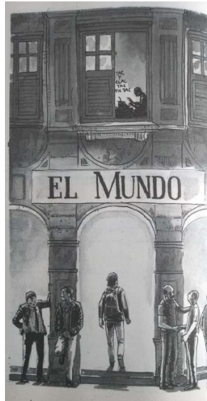
Figura 5 – Transição entre protagonistas