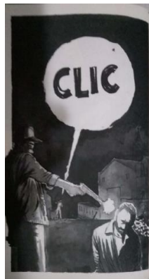
Figura 4 – Balão demonstra impacto do ato do jornalista

Na quarta página do quadrinho somos apresentados ao fotojornalista que captura o acontecimento que dita os rumos da narrativa. Ele fotografa um assassino de aluguel executando um homem a sangue frio. Porém, por mais que aparente que o assassino tomou a primeira iniciativa no jogo de ação, na verdade, foi o próprio fotojornalista que havia se preparado antecipadamente para fotografar o crime. A ação do jornalista é tratada como mais impactante pelo próprio autor, que retrata o barulho da câmera bem maior que o estrondo da arma. Por isso, desde esse momento, o fotojornalista já pode ser visto como protagonista. Como no momento mostrado na imagem a seguir que o personagem aparece diminuto na imagem mas a voz de sua ação é enorme: