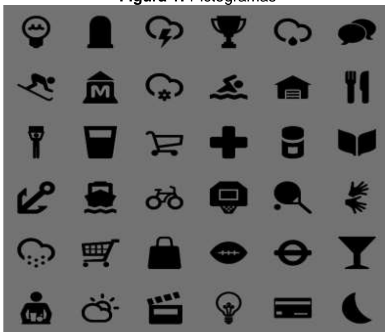
Figura 1: Pictogramas