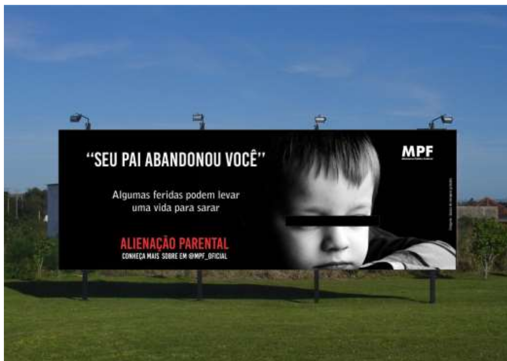
Imagem 5: Outdoor

Diante da possibilidade de que uma campanha pode ser aplicada em mídias online e offline , foi criado a arte com o intuito de utilizar a mídia de outdoor, visando aumentar o poder de penetração da campanha que possa permear por todo o tipo de público, dando abrangência e relevância ao tema abordado, conforme Imagem 5 apresentada.