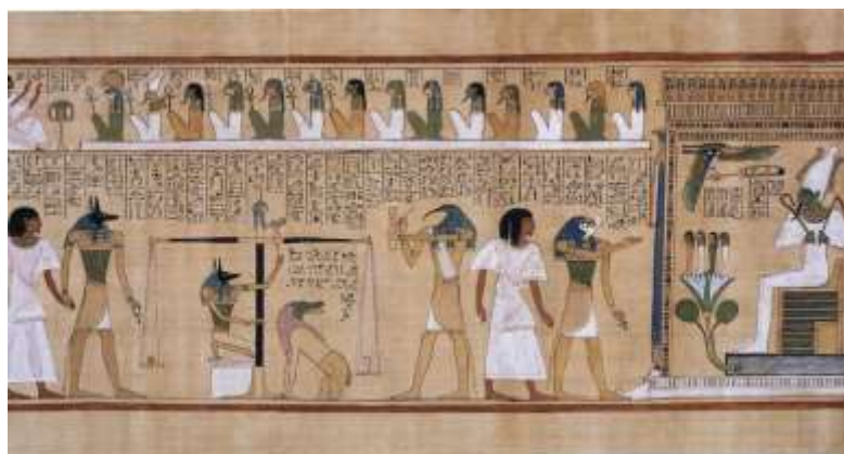
Imagem 2: Evidência da representação de Hieróglifos