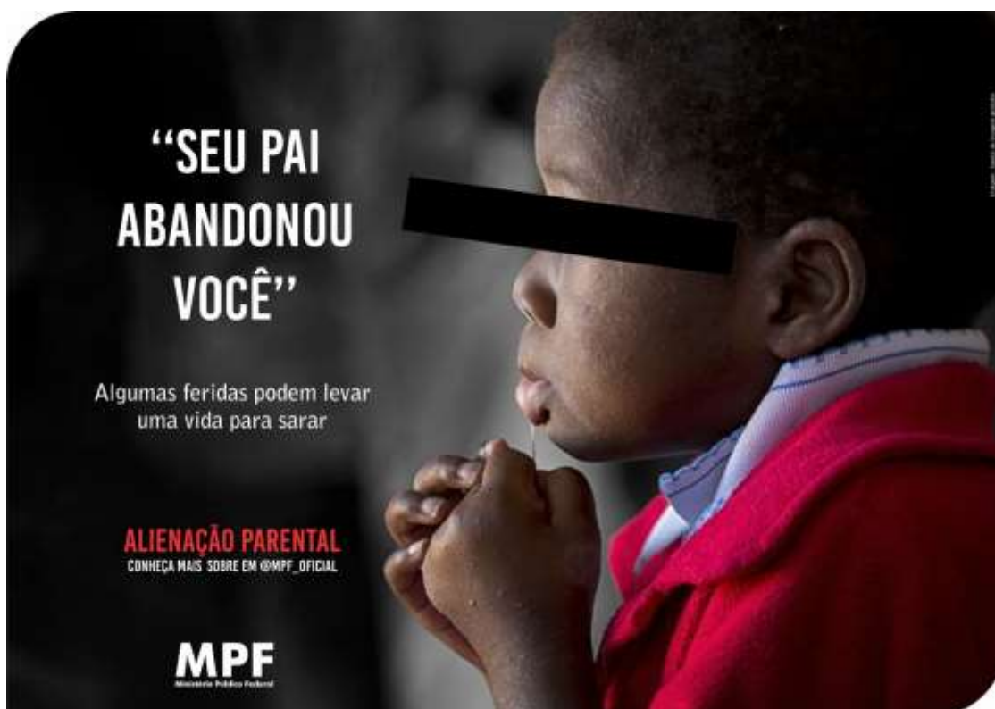
Imagem 3: Cartaz 1 - Criança negra.

Foram selecionadas imagens que se apresenta a exposição de forma individual, ou seja, cada peça com modelos diferentes, a proposta consiste em usar imagens de criança em situação de reflexão com semblante de abatimento, trazendo também criança negra com intuito de dar proximidade ao público brasileiro, enfatizando e valorizando a diversidade de racial, conforme ilustrado a seguir na Imagem 3.