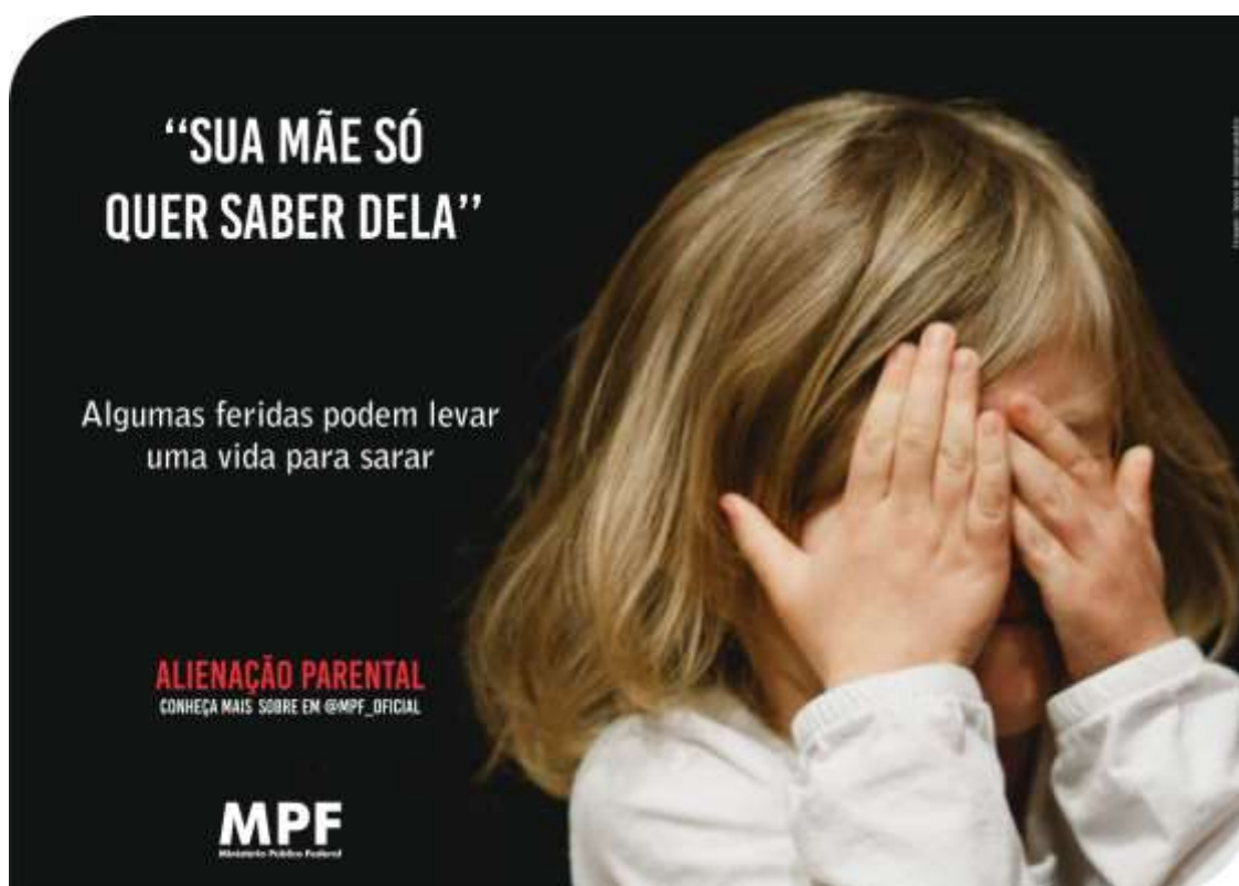
Imagem 4: Cartaz 2 - Criança com as mãos no rosto.

Quanto a imagem, foi escolhido o estilo de fotografia a qual utilizasse o fundo escuro, tendo como plano de imagem a posição de close e sempre buscando proteger a identidade das crianças. Essa escolha tecnicamente falando trará a obscuridade do assunto alienação parental. Quanto ao formato os cartazes foram criados no tamanho A3.