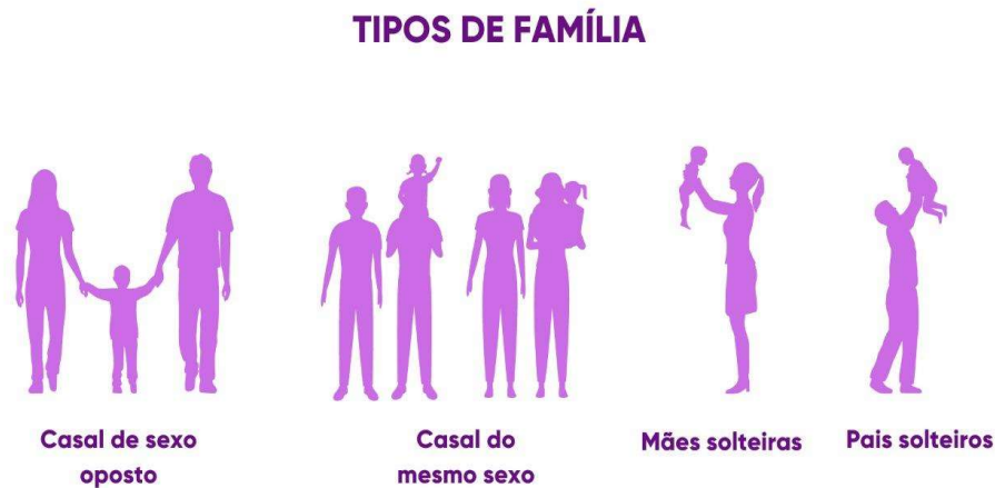
Figura 3: tipos de família