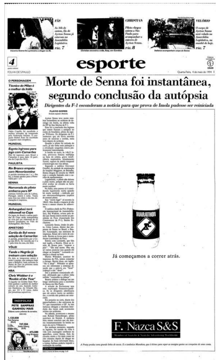
Figura 14 – Morte de Senna foi instantânea, segundo conclusão da autópsia