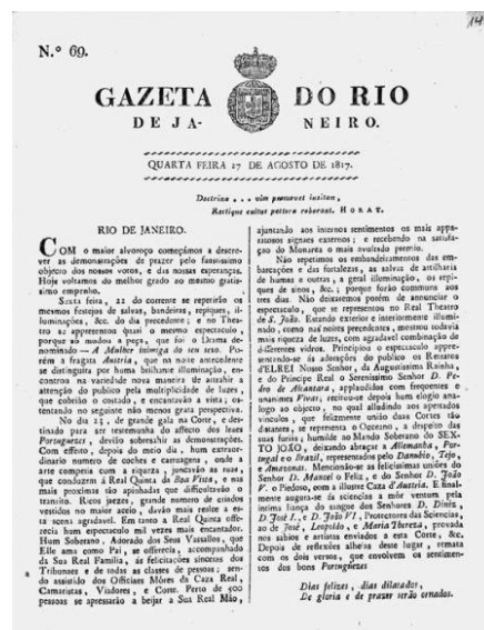
Figura 2: Gazeta do Rio