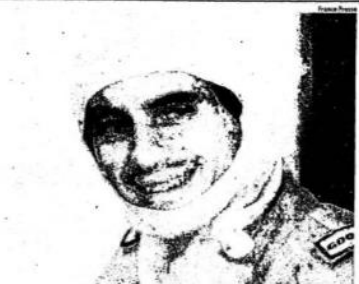
No circuito de Jerez, em 92, ele sorri no box da McLaren