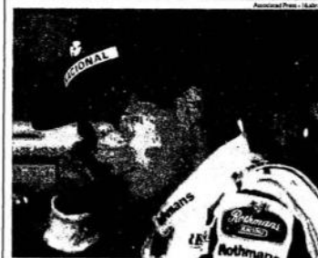
Senna mostra tensão nos boxes da pista de Aida, no Japão