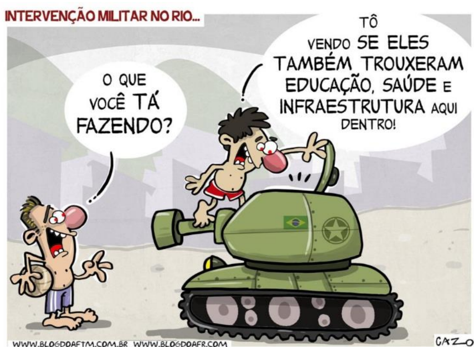
Figura 1 – Intervenção Militar No Rio

De acordo com os dados divulgados pelo Ministério da Defesa, entre 1992 e 2017, foram decretadas 132 operações de Garantia de Lei e da Ordem. Destas, a maioria envolveu missões de curta duração (entre 1 a 3 meses), seja para a ‘segurança em eventos’, seja para “garantir a normalidade das eleições” e também em episódios de “perturbação da ordem pública”, gerados por greves das polícias estaduais, casos de violência urbana, entre outros. (MD, 2017).